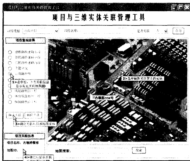
图 2 城建档案信息与三维实体关联管理界面

举例来说,其中的三维模拟城市管理系统是将二维地图上的项目关联到三维模拟城市中去,以直观、全面的反应建设项目的周边情况。如:某个小区房地产项目,通过三维建模描述小区各幢布局情况,同时与房地产项目系统进行衔接,展示每幢房源信息及其户型图,如图 2 所示。