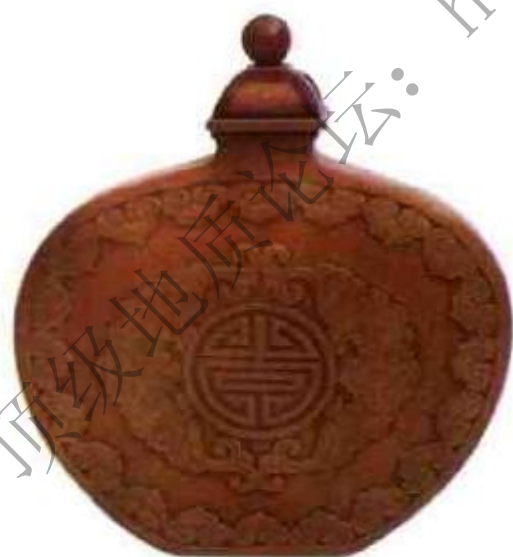
图93 清中后期贴黄鼻烟壶 这一品种鼻烟壶，先以福建上杭，湖南邵阳为产地，道光之后上海嘉定产生最大。

木制鼻烟壶。有乌木、紫檀、黄花梨、红木、桦木等。樟木、沉香木几乎未见，因樟木、沉香木均气味浓重，与鼻烟气味相串，所以这类气味浓的材质都不适宜制成鼻烟壶。木制