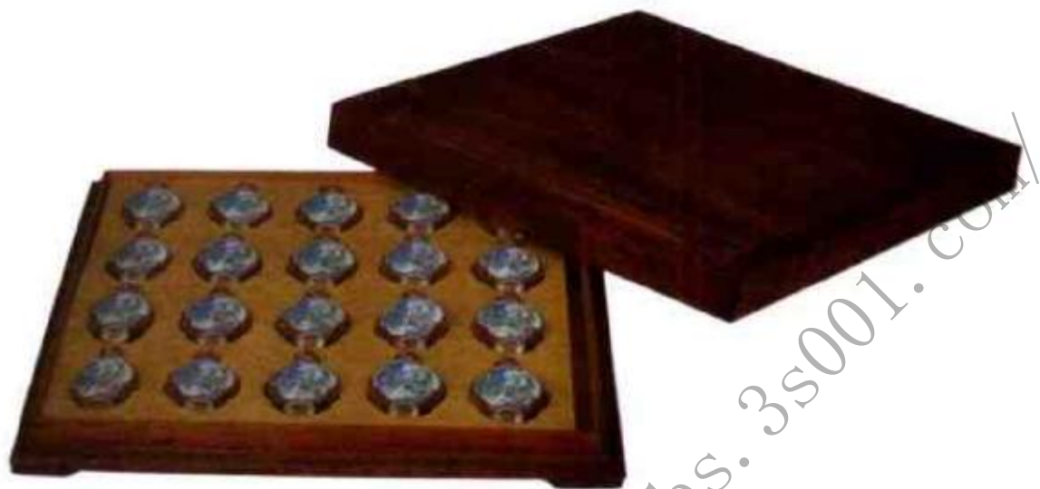
图27 清乾隆粉彩开光花卉鼻烟壶 一盒共20只。清乾隆帝喜爱鼻烟壶，几十年间生产各种形制的鼻烟壶不计其数。