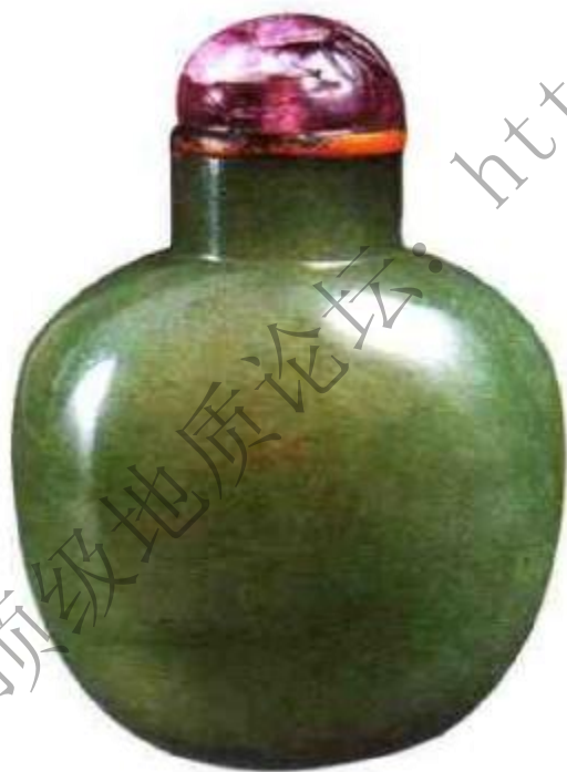
图55 清中晚期翡翠鼻烟壶，翡翠价值表现在其绿色越浓越好，质地透明度越高越贵重。

关禁，乃贡，所贡宝石为希珍矿物，（缅甸一般出产红、蓝宝石、猫眼、翡翠等，翡翠为其独有特产）。翡翠有绿色（图55）、白色、红色（图56）、紫色、黑色、灰色，以绿色透明度高者为贵，绿色、红色、紫色三色同在一件器物上称为福禄寿，十分珍贵。