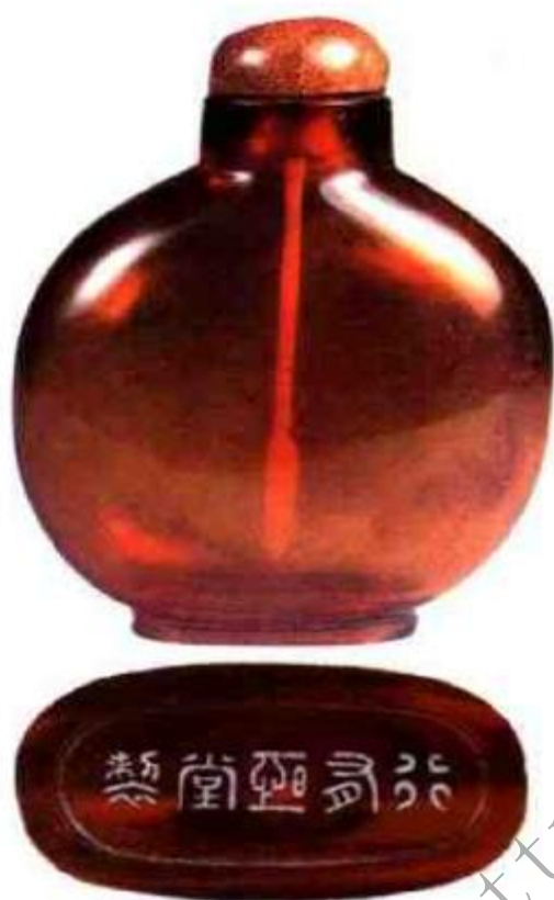
图6 行有恒堂款鼻烟壶 行有恒堂是乾隆帝弘历的曾孙载铨定王府所用堂号，载铨道光十六年袭定郡王，卒于咸丰四年（1854年），所用文玩器物皆精。

图，开设了“怡和”“天宝”等洋行，专营鼻烟，不仅贩卖也开始生产鼻烟销往全国成为著名商行。