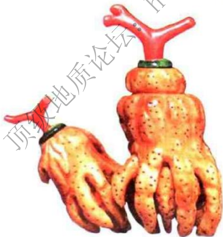
图98 清末骨雕佛手形双联鼻烟壶 骨雕盛行于清末民国时期，材料价格比象牙低，骨雕多形状奇巧怪异，也有些是象牙仿品。