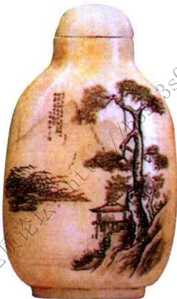
图99 清同治于硕微刻山水象牙鼻烟壶 于硕是同治时期象牙微刻名家，刻象牙印章常见，象牙鼻烟壶稀少。