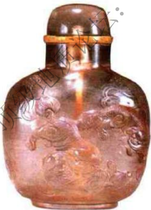
清中期水晶太狮少狮鼻烟壶 市场参考价：人民币6,000元