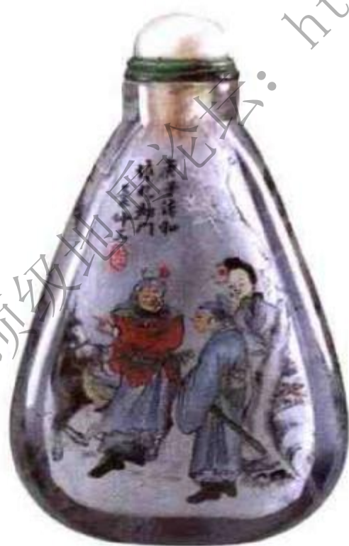
图82 叶仲三内画风尘三侠鼻烟壶。风尘三侠是隋唐传奇故事，讲的是隋朝大臣杨素的侍妾红拂女与李靖相爱，后与李靖私奔，途中遇虬髯公，虬髯公与红拂女结为兄妹，后来虬髯公帮助李靖和红拂女灭隋朝建立了唐朝。叶仲三的内画作品许多是反映民俗故事、民间传说。