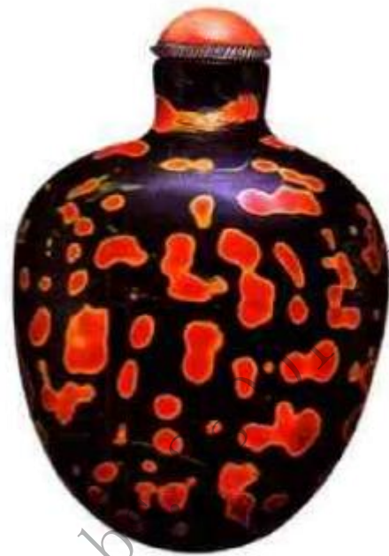
图15 紫地洒红斑玻璃鼻烟壶以紫色玻璃为底胎，在烧制过程中添入红色，使之形成大小各异红斑，颜色对比强烈，造型圆润可爱，为清中期产品，这种点彩花斑玻璃的制造手法是山东博山工匠创造，乾隆中后期成熟，色彩千变万化，令人赏心悦目。