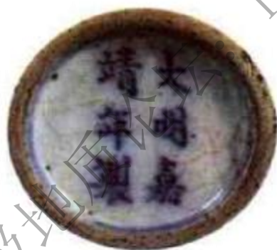
图3 清代鼻烟壶底的“大明嘉靖年制”寄托款

最早的鼻烟壶出现于何时，现在还是说法不一，有人认为是明代，有人认为是清初，目前现存最早有确切年款的是清