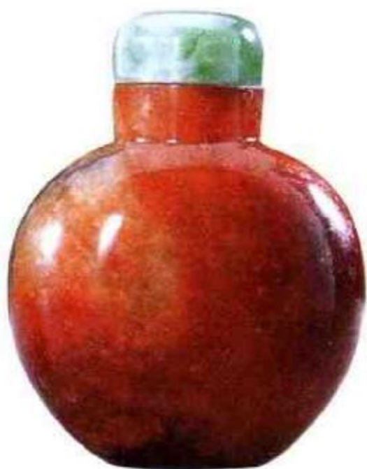
图56 晚清红翡素身鼻烟壶，红色翡翠是较常见品种，价值比绿色翡翠低很多。