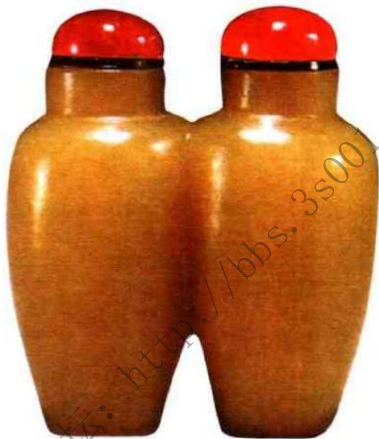
图40 清乾隆黄玉双联鼻烟壶 在清代黄玉为最贵重的玉材，价值高出白玉许多，这种特殊造型的双联鼻烟壶，玉质温润，在清代已是身价昂贵。

办处玉作所制玉石鼻烟壶，不惜用料，不计工本，只求其精美，造型古朴大方，琢工极细，图案吉祥，如羲之爱鹅，富贵白头、福祿万代等，古玩行称为“官造”或“官作”。康熙