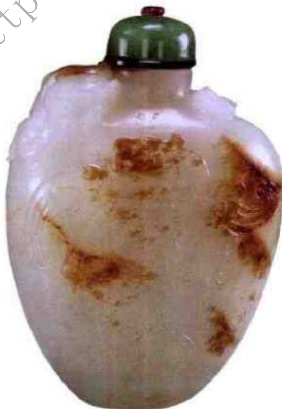
图45 清乾隆白玉留皮雕龙鼻烟壶 壶口处盘踞龙一条，气势雄浑，玉质为羊脂白玉，留有金黄色玉皮，为宫廷制品。