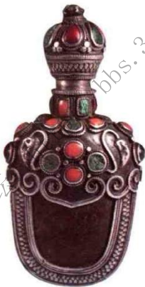
图103 清乾隆椰壳包银镶嵌珊瑚松石鼻烟壶

为蒙古、西藏少数民族人民喜爱。古玩行称为“蒙装烟壶”或“藏装烟壶”（图103）。