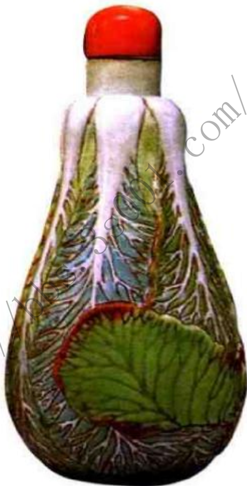
图35 现代仿古雕瓷白菜粉彩鼻烟壶，这是目前景德镇最常见的仿品之一，壶形很规整，雕工也不差，只是绿色发色为嫩绿，与旧时淡绿略有差别，另外胎质比道光时干净瓷质更细。