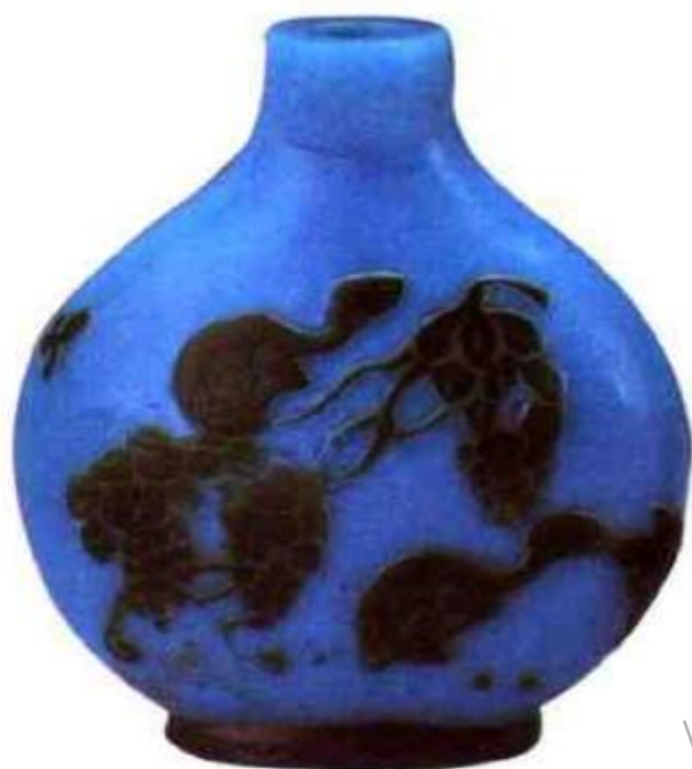
图19 蓝地套绿料 松鼠葡萄鼻烟壶 此壶 所用蓝地绿料烟壶坯胎 为清中后期之物，但雕 琢工艺为现代仿旧，古 玩行称为“旧料新作” 其松鼠葡萄作法缺少立 体感，死板。