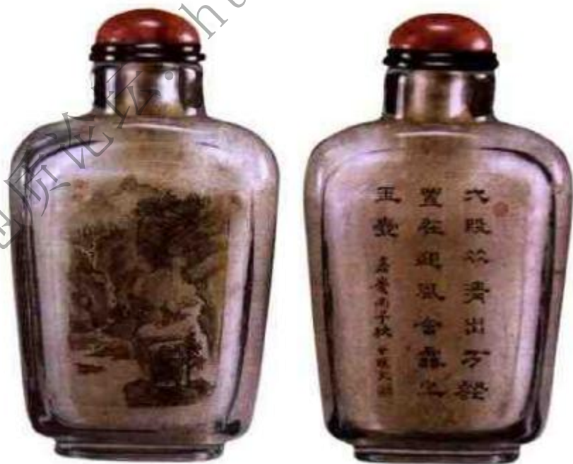
图8 甘文内画鼻烟壶 是现存最早有确切年款记载内画鼻烟壶。绘于嘉庆丙子年秋。（1816年）。

鼻烟壶自顺治始在清代三百年间得到极大的发展，科学客观地鉴别，对每一收藏者来说都很重要，只有不断研究学习，掌握清代各时期的制瓷、绘画、琢玉、镌刻、造形等特点，才能成为鼻烟壶方面的专家。