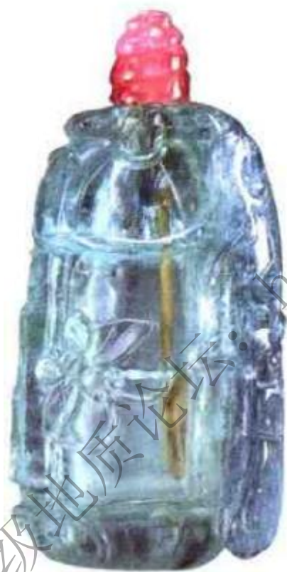
图64 清中期海蓝宝石鼻烟壶 颜色为淡蓝，壶身雕瓜蝶，宝石材料较小，制成鼻烟壶者稀少。

膛壁较厚，因料质贵重，制作者不舍浪费，故而随形者较多，方正者较少，质地纯净，无绺裂，造型规整颜色艳丽纯正为最佳（图64）、（图65）、（图66）。