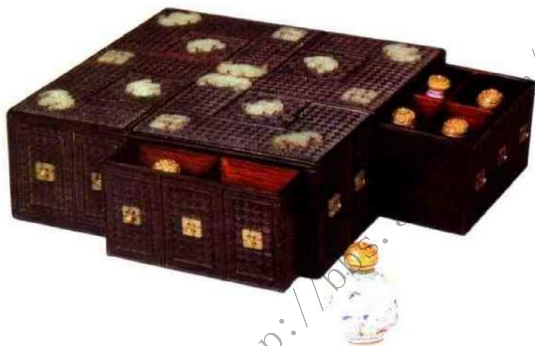
图5 造办处专门为乾隆皇帝盛放鼻烟壶设计的盒子，四侧各有一抽屉，每屉四格共装16个鼻烟壶。

五十六年（1717年）法国珐琅艺术家格雷佛雷被任命为清宫造办处珐琅作匠役长，专门为宫廷制造精美的画珐琅制品。清圣祖通过各国使节把中国精美的画珐琅鼻烟壶转赠给各国国王。康熙时期生产规模有限，传世鼻烟壶稀少。