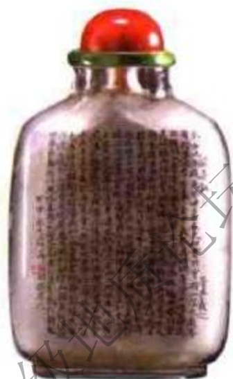
图84 丁二仲内画山水鼻烟壶 丁二仲书法功力深厚能写多种笔体。壶中所书为晋朝王羲之的《兰亭序》。

是非同寻常，各体书法皆精到，其书法潇洒豪放，流畅自如，与马少宣的古朴严谨有明显区别（图83）、（图84）、（图85）。丁二仲多才多艺，其在治印及竹刻、木刻均有所成。