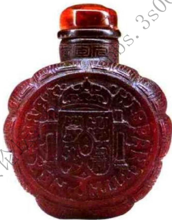
图100 十九世纪犀角刻西班牙银币图鼻烟壶 犀牛角是贵重的药材，制成鼻烟壶者极少见。

等地，一般均有刻工，光素者少，以犀牛角所制鼻烟壶为贵，水牛角所制平常（图100）。