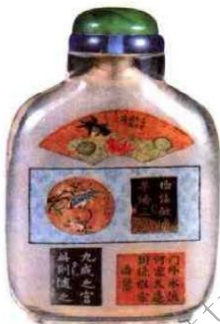
图75 马少宣内画 仿名人书画鼻烟壶 在小小的鼻烟壶上仿司马钟八大山人绘画，临九成宫碑帖，临潘祖荫书法无不传神，可见马少宣内画功力之深厚。