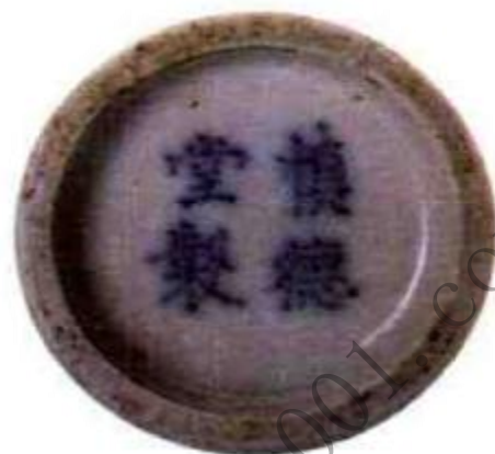
图24 青花人物鼻烟壶底款 从露胎处可看出胎土含有杂质，白度不如康、雍、乾时期，这也是道光瓷的基本特征。