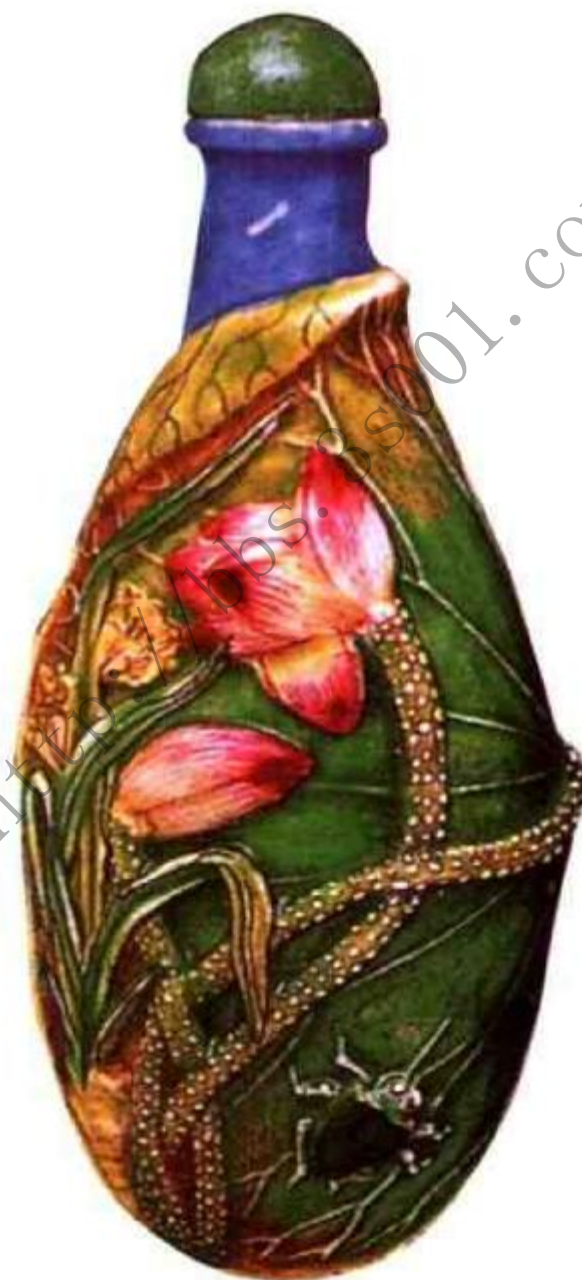
图33 清道光雕瓷荷花草虫鼻烟壶 道光年间雕瓷盛行，生产数量超过前朝，即使无款作品也不乏创意生动之作，此壶构图不俗，雕工精细，色彩艳丽是道光无款雕瓷中的精品。

晚清、民国时期瓷制鼻烟壶少见精品，制作水准已是大不如前，大多施釉稀薄，釉面多有杂质，白里透灰，光绪、民国时更明显，俗称“傻白釉”，看上去