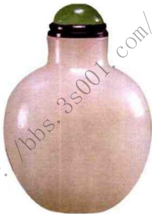
图46 清早期羊脂白玉素面鼻烟壶 小巧秀美，洁白无瑕。

清代人崇尚玉质的温润，讲究“无绺不做花”，保持玉圆浑润泽的质感，制作了大量素面玉烟壶，为了不过于单调又设计了各种不同造型令人爱不释手（图46）、（图47）。