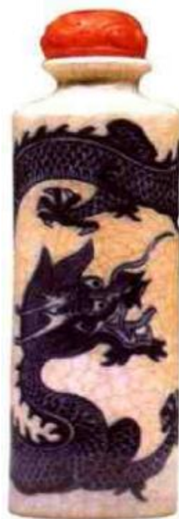
图25 嘉庆浆胎青花龙纹鼻烟壶 壶形俊秀，青花发色明艳，所画龙纹气势雄浑，带有乾隆朝遗风，浆胎瓷，又称“煨瓷”，煨瓷胎质松，开片者多。是清嘉庆至光绪时期常见品种。