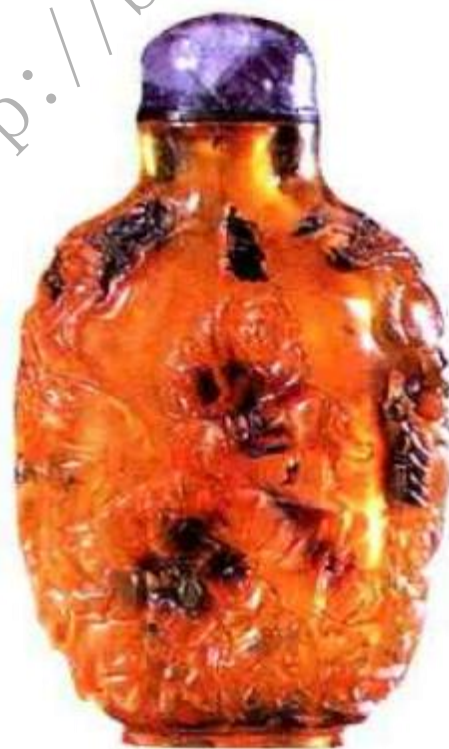
图102 现代仿古金珀雕人物鼻烟壶 一般年代较好的金珀鼻烟壶透明度较高，此壶雕工虽有旧意，但其质地浑浊，一看便知不是旧时制造烟壶所选之料。