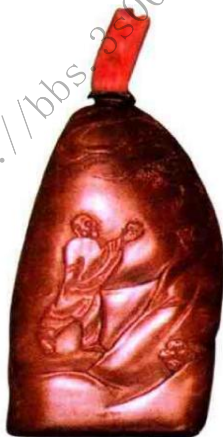
图70 近代寿山石印章形鼻烟壶 此壶原本为一方普通寿山石印章，有心者在其顶部掏膛，改制成鼻烟壶以增其身价，这是作伪的常用手法。