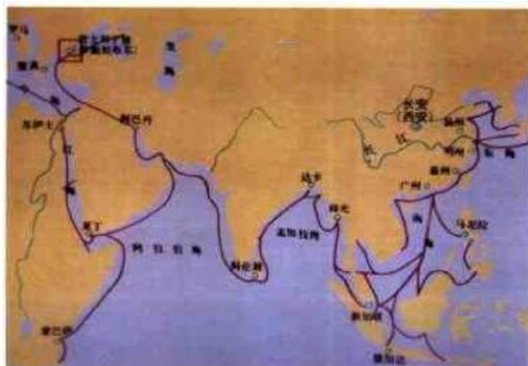
图1 海上丝绸之路虽以丝绸贸易为开端，但其意义却远远超过丝绸贸易的范围，同时把外国特产如：棉花、烟草、龙眼、番茄、占城稻、玉米、蕃薯、花生、向日葵、土豆、西红柿等新品种传到我国。

习俗。清初顺治时期，统治地位尚不稳定，经明末清初战乱不断，社会经济一片萧条，顺治帝设立海禁，吸闻鼻烟的人很少。康熙帝在位六十一年，国泰民安，经济繁荣，社会稳定，中国成为世界上最强盛的国家，康熙废除海禁令，中国同欧洲的贸易日益增多，此时大多通过海上丝绸之路进行贸易往来，吕宋国（今菲律宾吕宋岛）马尼拉港，是中国对欧洲的主要中转港口，唐宋时期，广东福建等地与菲律宾群岛有着密切的商业往来，清代开放海禁后经泉州、漳州、广州的商船与马尼拉的鼻烟贸易成倍增长（图1）。