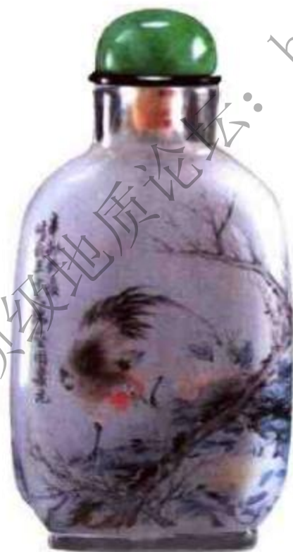
图86 周乐元内画归渔图鼻烟壶 周乐元传世内画鼻烟壶数量稀少。其特点是山水、人物、花卉留白较多，画面不会画得太满。意境不俗，富有诗意。

诗中有画，画中有诗，意境深远。周乐元内画艺术修为极高，作品数量十分稀少，历来为藏家所珍爱，后世仿品很多，但多是有其形而不得其神（图86）、（图87）、（图88）。