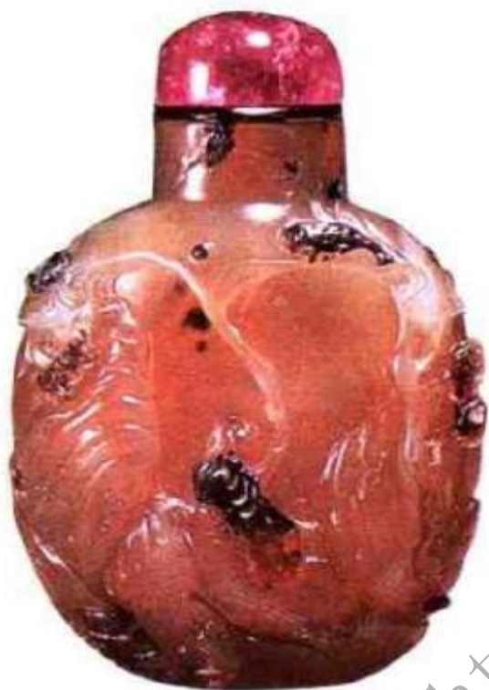
图48 清乾隆苏作刘海戏蟾玛瑙鼻烟壶 雕琢玉工巧妙地利用玛瑙材质上的黑色雕成刘海、蟾、山石、树木相映成趣，是苏作玛瑙鼻烟壶精品。

玛瑙鼻烟壶出现应比玉质鼻烟壶略晚，因目前所见大多为乾隆年间制品，康熙时期有年款的还从未见到。玛瑙苏作烟壶最有代表性（图48）、（图49），构思巧妙的玉工能利用玛瑙材质上的颜色或杂质，设计出各种动物、人物、昆虫、花卉等图案，巧作鼻烟壶在乾隆时达到最高水准。利用鼻烟壶大片黑色制成图案的烟壶，