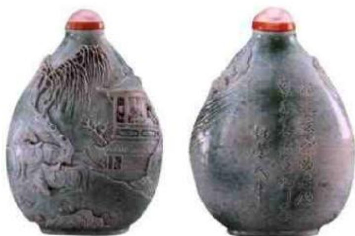
图7 王炳荣雕瓷鼻烟壶 正面雕亭台楼阁，人物骏马，阴刻诗句，款识“炳荣氏作”，为阳雕。此壶形制特别，为道光年间王炳荣雕瓷精品。

清末民国的鼻烟壶水平不高，在各类鼻烟壶中内画鼻烟壶异军突起成为新贵。内画鼻烟壶相传始于乾隆末年，有位小吏进京办事，盘缠用尽，寄宿一古庙中，他嗜鼻烟如命，苦于无钱购买，无耐只好用烟匙刮粘在壶内壁上的鼻烟，在内壁上划了许多痕迹，一位和尚看后受到启发，便弯勾竹签蘸上墨，伸