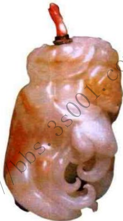
清中期白玉佛手形鼻烟壶 市场参考价：人民币20,000元