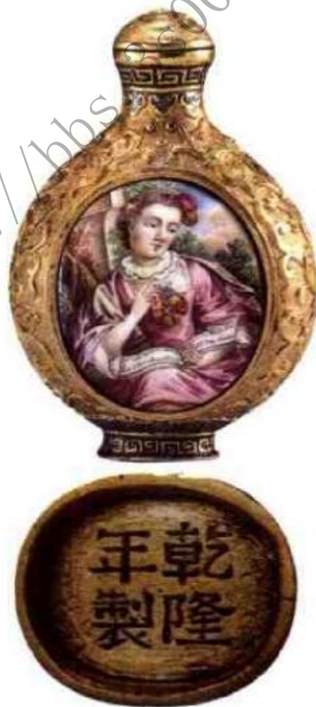
图9 乾隆铜鎏金开光画珐琅西洋美女鼻烟壶 开光处画珐琅彩绘西洋美女，边饰阳刻鎏金宝相花，底足阴刻“乾隆年制”极工整，为宫廷造办处代表作品。