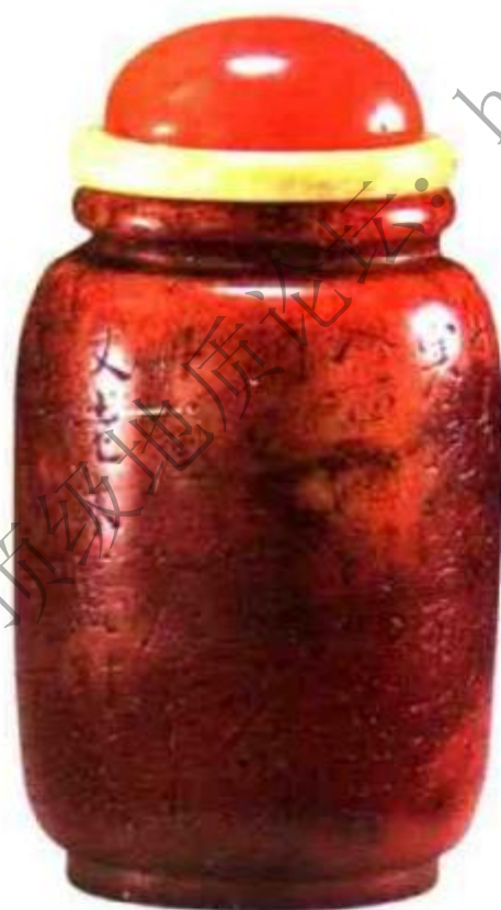
图69 清中期寿山石刻诗文墩式鼻烟壶 寿山石质地软，是制印章的好材料，做成鼻烟壶的很少见。

人墨客喜爱，由于硬度不高易划损，很少制成器皿，制成鼻烟壶的数量就更少见，目前市场中工艺水平较好的寿山石鼻烟壶均价格不菲（图69）、（图70）。