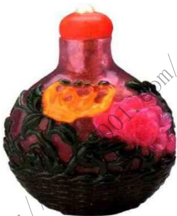
图17 粉色地套五色花篮纹鼻烟壶 以粉色料为底胎，套以绿色为花篮、叶蔓、其他色作佛手、樱桃花卉，线条古朴，是京作套料鼻烟壶中的上品。

套料鼻烟壶精品早期出自北京，俗称“京作”（图17），同治以后扬州套料俗称“苏作”（图18）异军突起，与北京套料形成两大流派，京作古朴厚重，苏作细腻纤秀（图19）（图20）。