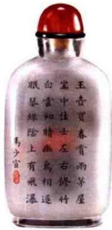
图74 马少宣内画京剧人物鼻烟壶 马少宣内画作品中书法多用楷书，造诣极深。他的每件作品，都力求完美，画工精益求精。