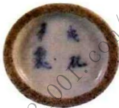
图4 康熙年间“多年”款

最早的鼻烟壶出现于何时，现在还是说法不一，有人认为是明代，有人认为是清初，目前现存最早有确切年款的是清