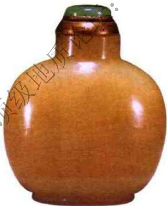
图47 清中期黄玉素面鼻烟壶 壶形厚重，黄玉质地纯净，充分表现黄玉柔和美感。