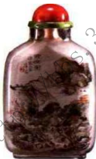
图83 丁二仲内画山水鼻烟壶 丁二仲擅山水，方寸之间能容百川，其间树木、人物、亭台、楼阁皆为画龙点睛之笔。