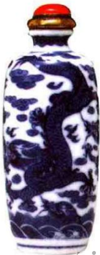
清中期龙纹青花鼻烟壶