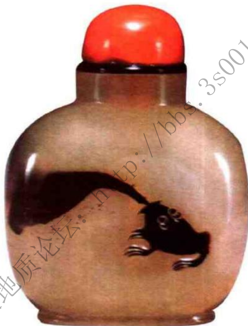
清中期金蟾吐福玛瑙影子鼻烟壶 市场参考价: