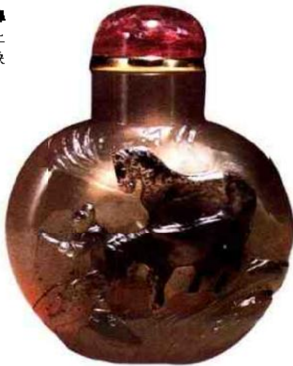
图49 清乾隆苏作双骏图玛瑙鼻烟壶 壶中人物衣帽为黑色，面部手部为白色，双骏花斑，构思极巧，是苏作玛瑙鼻烟壶极品。