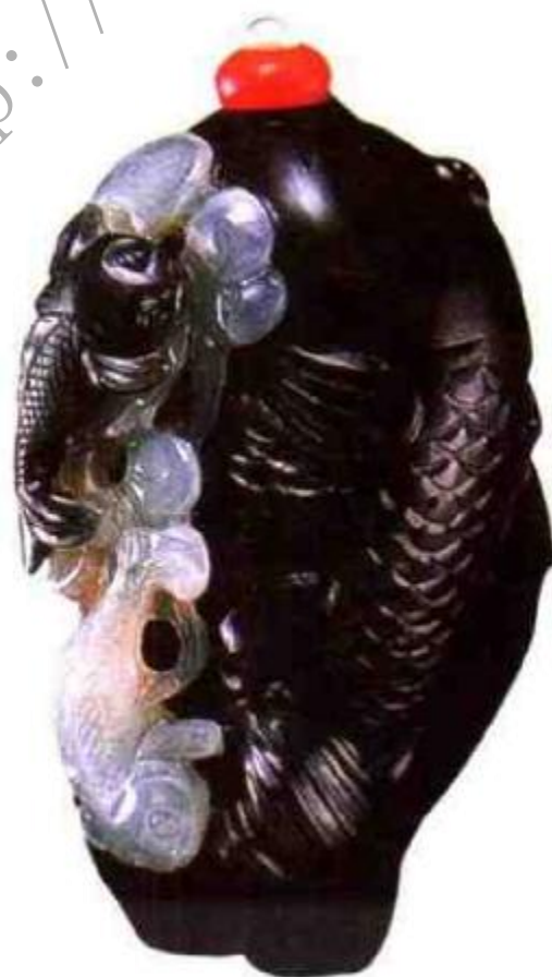
图39 乾隆苏作黑白玉巧雕三鱼鼻烟壶 清代苏州是重要的玉器加工地之一，出了许多能工巧匠，他们以巧思、巧雕为主，能用平常的玉料制成不凡的玉雕作品。

玉质鼻烟壶始于清康熙，康熙年间琢玉以苏州工匠工艺最精，当时苏州也是全国玉器加工中心，苏州地区能工巧匠众多，生产玉鼻烟壶式样规整，琢工细致，设计新颖，古玩行称为“苏作”烟壶（图39），清康熙帝在京城造办处设有玉作，所用之工匠皆为能手，造