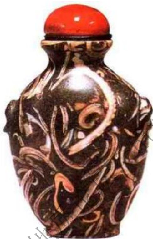
图71 清末彩石素身鼻烟壶。清代嘉道以后几乎所有能想到的材质，都曾被制成鼻烟壶，可见其风之盛。彩石鼻烟壶为表现石质花纹美感，大多制成素面。

点或线交相辉映，对比强烈，十分惹人喜爱。中国古代文人历来爱石，石制鼻烟壶是文人玩石的另类产物，也是美石文化的延伸（图71）、（图72）。