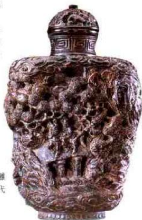
图96 近代松木雕山水人物鼻烟壶雕繁复，通身满工。壶盖亦是松木雕成年代虽近，也是有特色的作品。