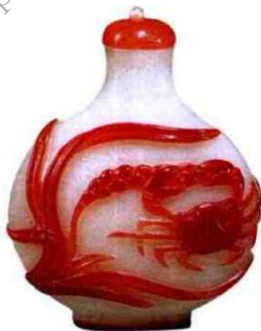
清中期菲雪地套红蟹趣图套料鼻烟壶 市场参考价：人民币8,000元