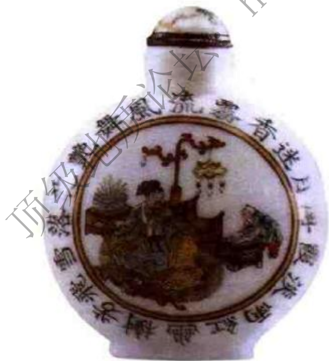
图30 清道光粉彩开光人物风花雪月词鼻烟壺 构图独特，书画皆精，是底书“道光年制”，是道光粉彩精品。