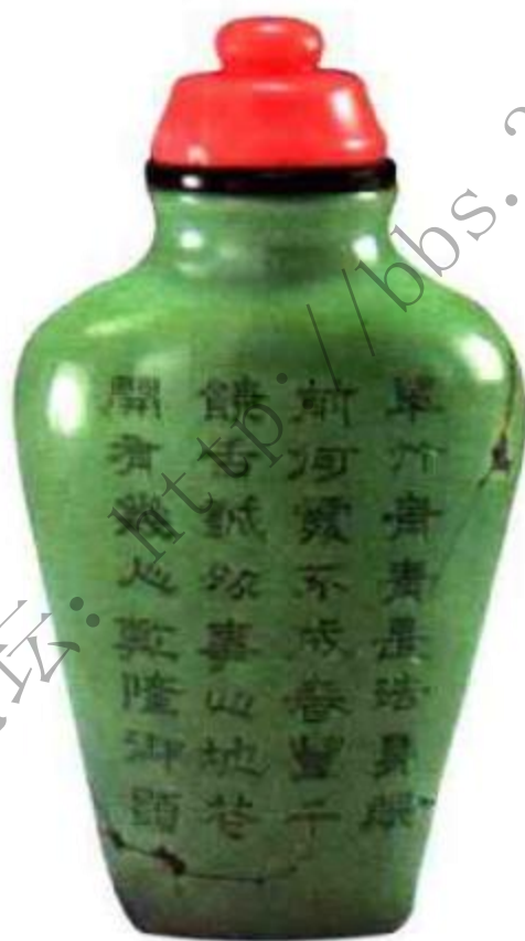
图62 清乾隆御题诗文松石鼻烟壶 御题为隶书诗文一首，字体高古，雕工精细，足底阴刻“乾隆年制”四字款，应是乾隆本年官器。

密，硬度不高，宜生划痕，且大多原料多裂纹，不太适合制成鼻烟壶，清代松石主要制成鼻烟壶盖，制成鼻烟壶较少（图62）、（图63）。