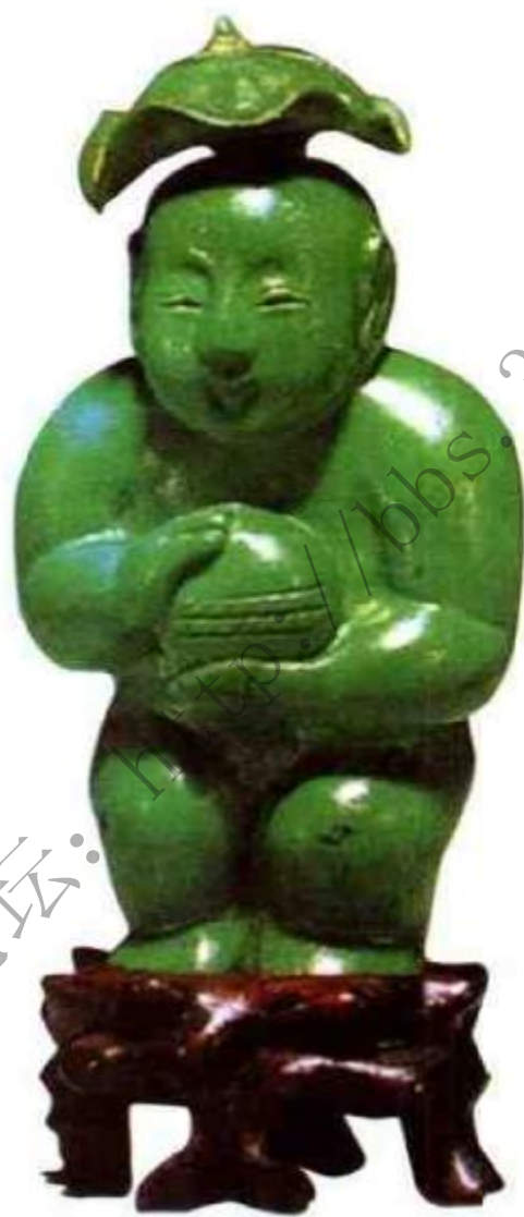
图63 民国和合童子松石鼻烟壶 壶身雕成童子 头顶荷叶为鼻烟壶盖，童子面目可爱，手中捧盒，此 壶年代虽近，创意巧妙生动，也是民国时期鼻烟壶的 精品。