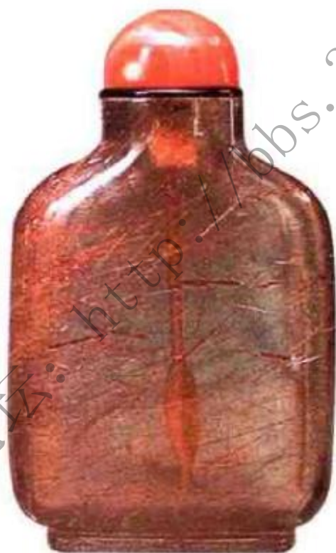
图57 清中期棕晶素身鼻烟壶 水晶中含有棕毛状杂质，称为“棕晶”，棕晶制成鼻烟壶，别具特色，一般素身较常见。

称为茶晶，紫色透明称为紫晶，有些水晶内有发丝状黑色杂质称为发晶，有些水晶内生海藻状杂质，称为杂草水晶（图57）、（图58）、（图59）。