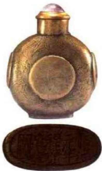
图2 清顺治元年程荣章造铜阴刻龙纹鼻烟壶