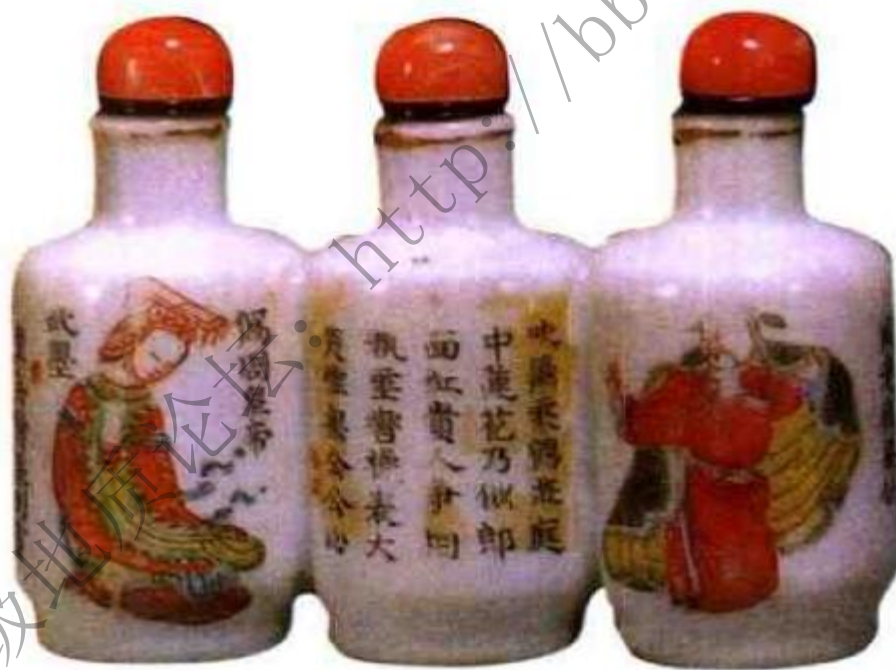
图31 道光粉彩人物诗文三联鼻烟壶 嘉道盛行双联、三联等特殊造型鼻烟壶，这种三联壶可装三种不同味道鼻烟，使用携带方便。

识，少部分落年款，从瓷质上看，嘉道时期所制瓷烟壶比乾隆时期有所下降，画工，制胎，用色，用料皆不如乾隆时期讲究，尤其是鼻烟壶壶口壺肩，制作没有乾隆时期那样平齐，棱角略显圆钝，纹饰上比