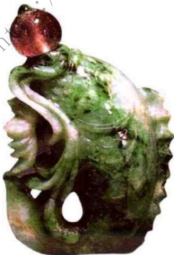
图41 晚清翡翠鱼形鼻烟壶 这是一件典型“穗作”翡翠鼻烟壶。 “穗作”多喜浅雕，造型较新颖。

各地琢玉高手，玉石鼻烟壶在这个时期达到了最高的水平，许多精美独特的烟壶均是这一时期制造，乾隆帝对玉皮十分喜爱，所以这一时期出现大量留有玉皮的玉烟壶，有些更是只选用玉质细润态周正、皮色澄黄的玉料，直接掏膛，保持其天然形状形状，异趣天成（图42）、（图43）、（图44）、（图45）。