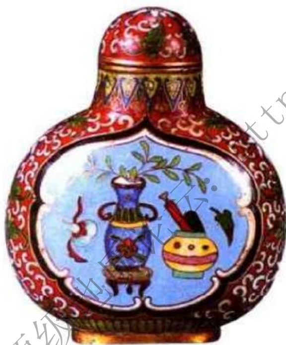
图13 清乾隆铜胎掐丝珐琅开光博古纹鼻烟壶 掐丝珐琅器，明代景泰年间在北京开始大量制造，珐琅彩釉多用蓝色故称景泰蓝。此壶是以紫铜做胎，把铜丝掐成各种花纹焊在铜胎上，填上珐琅彩釉，以后低温烧成，图案繁而有序，壶口，底足鎏金为乾隆时期典型代表作品。

又称料胎鼻烟壶，玻璃是一种硬而脆的物体，一般为石英沙、石灰石、纯碱等混合后，在高温下熔化，成型冷却制成各种形状。玻璃的烧制与使用已有几千年历史，清代玻璃制品产量很大，大器型很多，