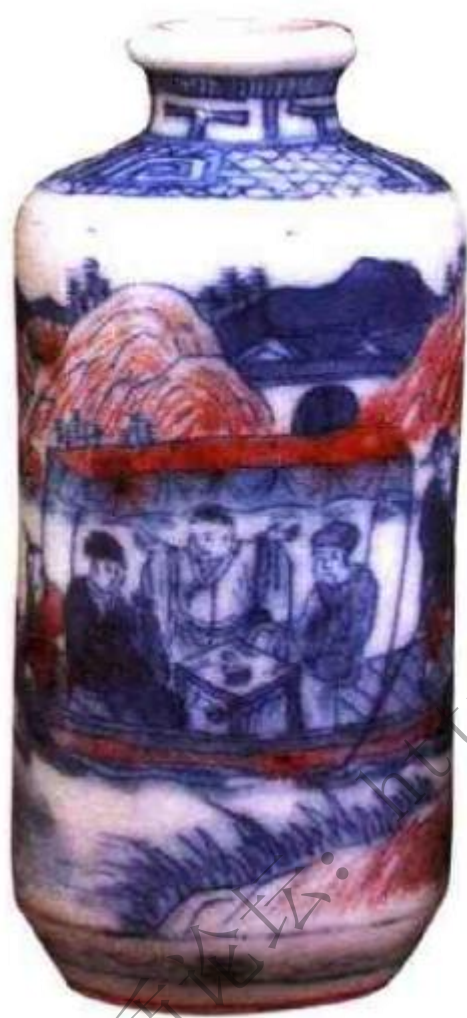
图26 现代仿道光青花加紫夜游赤壁鼻烟壶。壶中所有人物、山水船先以细笔勾出轮廓后在轮廓内绘釉里红，青花，这是现代景德镇仿清代青花釉里红鼻烟壶的特征之一，其青花发色大多呈蓝黑色。

花釉里红鼻烟壶，釉色偏白（俗称傻白釉）画工多不精，精品凤毛麟角，现代新仿品底足规整款识多以细笔平描，釉