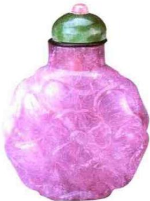
图65 清晚期粉 红碧玺鼻烟壶，颜色 为粉红色，壶身雕花 卉。碧玺因慈禧太后 喜爱，身价倍增，在 清末盛行。