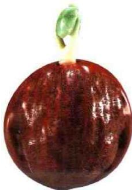
图108 清乾隆核桃雕人物鼻烟壶 满刻诗文，字字精巧，落款阴刻“乾隆年制”四字篆书。