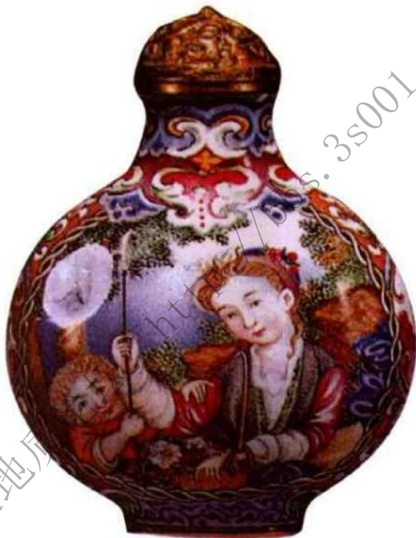
清乾隆铜胎画珐琅西洋仕女鼻烟壶 市场参考价， 人民币180,000元