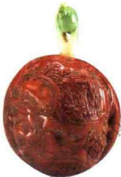
图107 清乾隆核桃雕人物鼻烟壶 核桃雕刻鼻烟壶制作数量十分稀少，精品更是不多，此壶雕精细，题材为携琴访友图，是果实类鼻烟壶中的珍品。