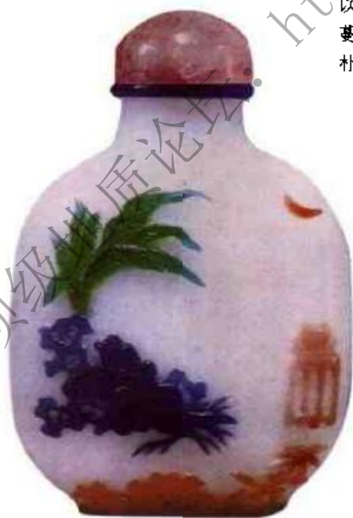
图18 白地套六色料鼻烟壶 白胎素洁，以各色雕琢春江水映图案，线条，刀法秀雅，明显有别于京派作法，是苏作套料鼻烟壶中的精品。