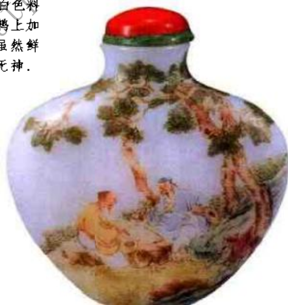
图12 民国仿古月轩鼻烟壶 与现代仿古不同在于它所用珐琅彩料，明显灰暗，施釉显得薄，其画法与民国时流行的浅降山水画法相似。

落款，大多为描蓝仿体四字款，料胎画珐琅则有阴刻泥金篆书四字款，描蓝年款。古月轩款瓷胎鼻烟壶题款较多样，有堆料红、蓝料款，描蓝年款，胭脂水印章款，红印章款等。另有一类铜胎掐丝珐琅称景泰蓝，与画珐琅同属一科，景泰蓝制品以大件居多，制成鼻烟壶者较少，其铜胎胎厚，掐丝填料之后，体重增加，再装鼻烟后，过重，不便于携