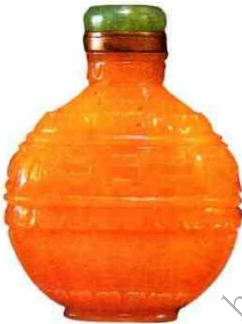
图14 清乾隆鸡油黄兽面龙纹鼻烟壶 颜色纯正通身刻米纹地，腹刻兽面龙纹，线条流畅，造形浑厚，底足篆书“乾隆年制”，为典型乾隆时期“官料”精品。