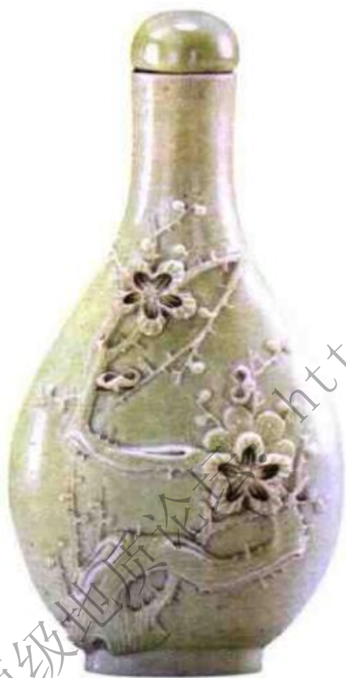
图34 清道光绿釉雕梅花鼻烟壶 底足阴刻“王炳荣制”四字款，王炳荣为道光时期著名雕瓷高手，与王炳荣齐名的还有陈国治，此壶梅花雕法与众不同，是王炳荣代表作品。