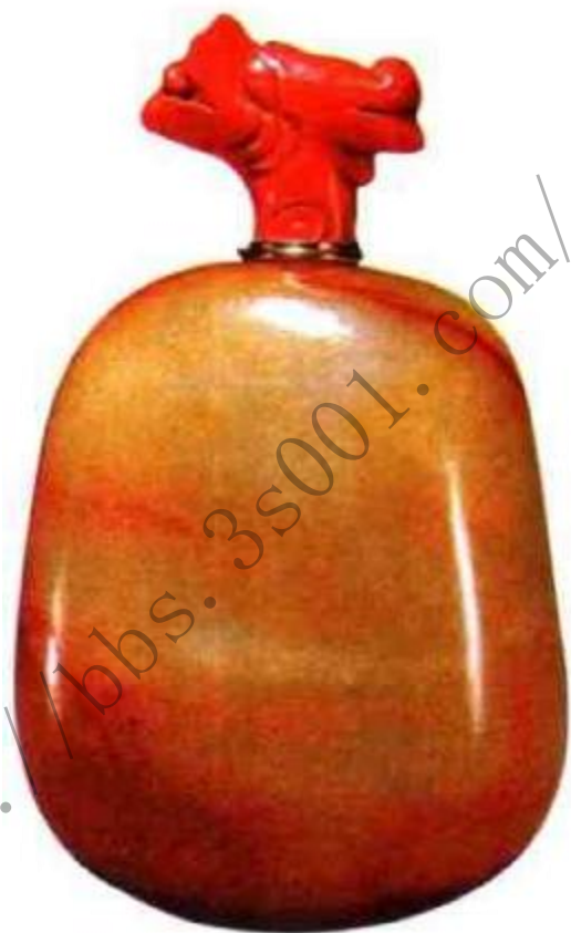
图43 清乾隆白玉留皮素面鼻烟壶 这类留皮鼻烟壶有的有雕工，有的是素面无雕工，大多为乾隆、嘉庆年间作品，主要表现玉色之美。