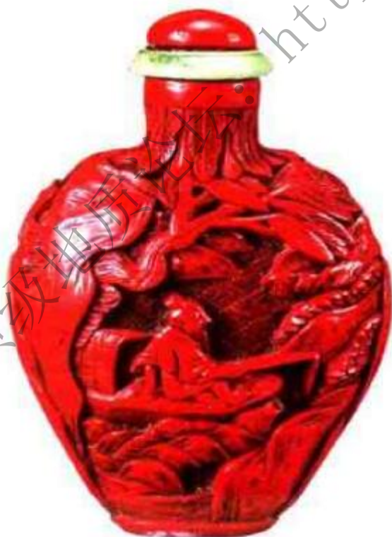
图106 清中期剔红漆羲之爱鹅鼻烟壶 剔红是雕漆工艺中常见品种，传世作品也较多。