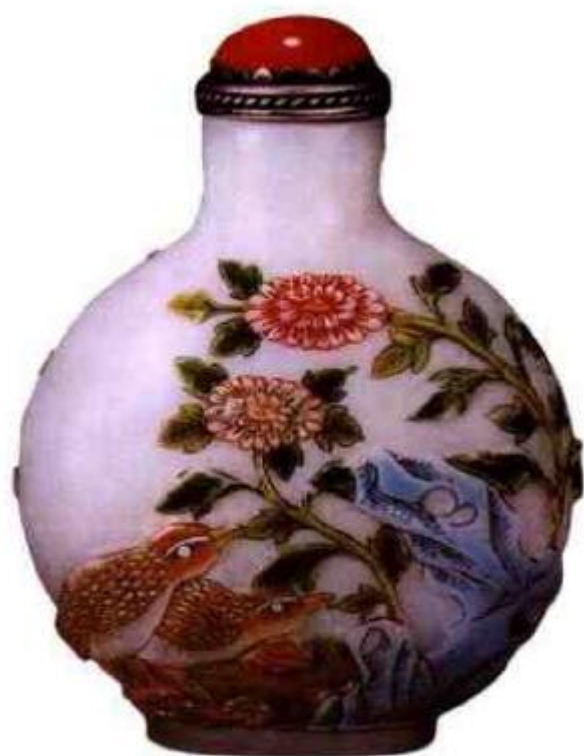
图11 近代仿古月轩鼻烟壶 先在白色料胎上浮雕花卉，鹤鹑，再在花卉，鹤鹑上加绘珐琅彩，低温烘烧而成，红花绿叶虽然鲜丽，但现代气息明显，鹤鹑画法呆板无神，与真正古月轩生动传神笔法差距很大。

古月轩款鼻烟壶，因其制作精美，数量稀少，故而在清代已是众多藏家追捧之物。价值可观，光绪民国期间便有古玩商大量仿制，虽也不乏精美之作。但大部仿品已是形似神失，与前朝相去甚远（图11）、（图12）。