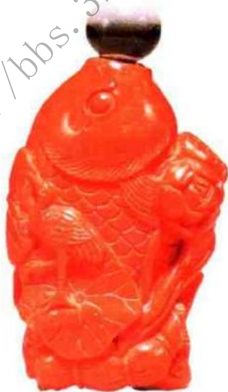
图61 现代仿古连年有余珊瑚鼻烟壶 现代仿古珊瑚鼻烟壶大多雕工复杂，很少制作素器，一般表面抛光较亮，内膛偏小。