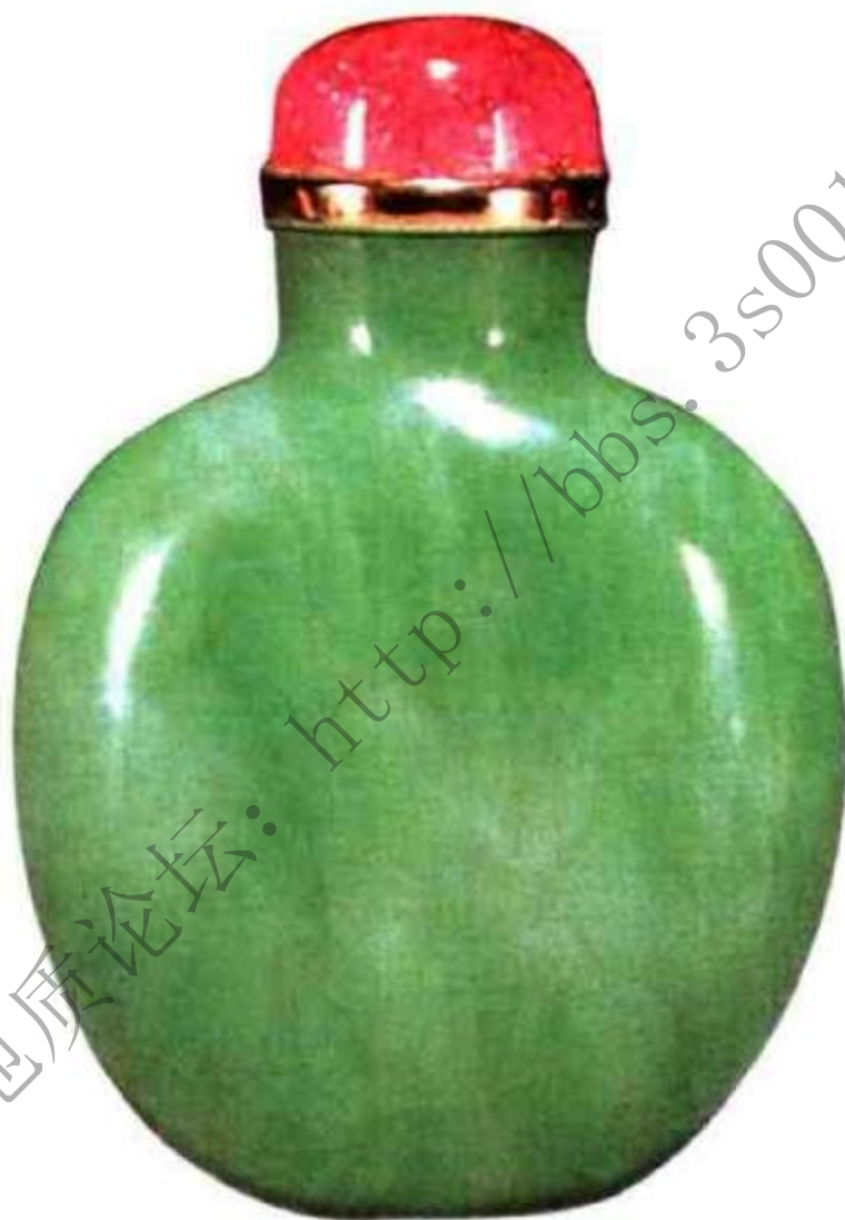
清晚期翡翠鼻烟壶 市场参考价 人民币3,0000元