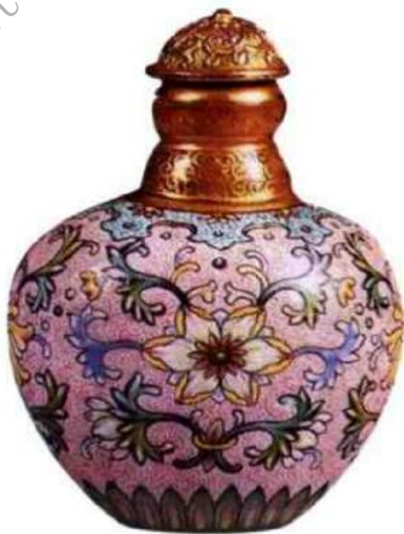
图28 清乾隆粉彩轧道西番莲鼻烟壶 造型规整，绘工精美，受西域风格影响，是典型乾隆官窑鼻烟壶。