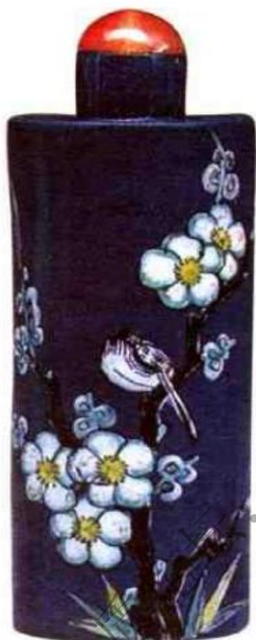
清末紫砂胎蓝釉绘喜鹊登 梅粉彩鼻烟壶 市场参考价： 人民币6,000元