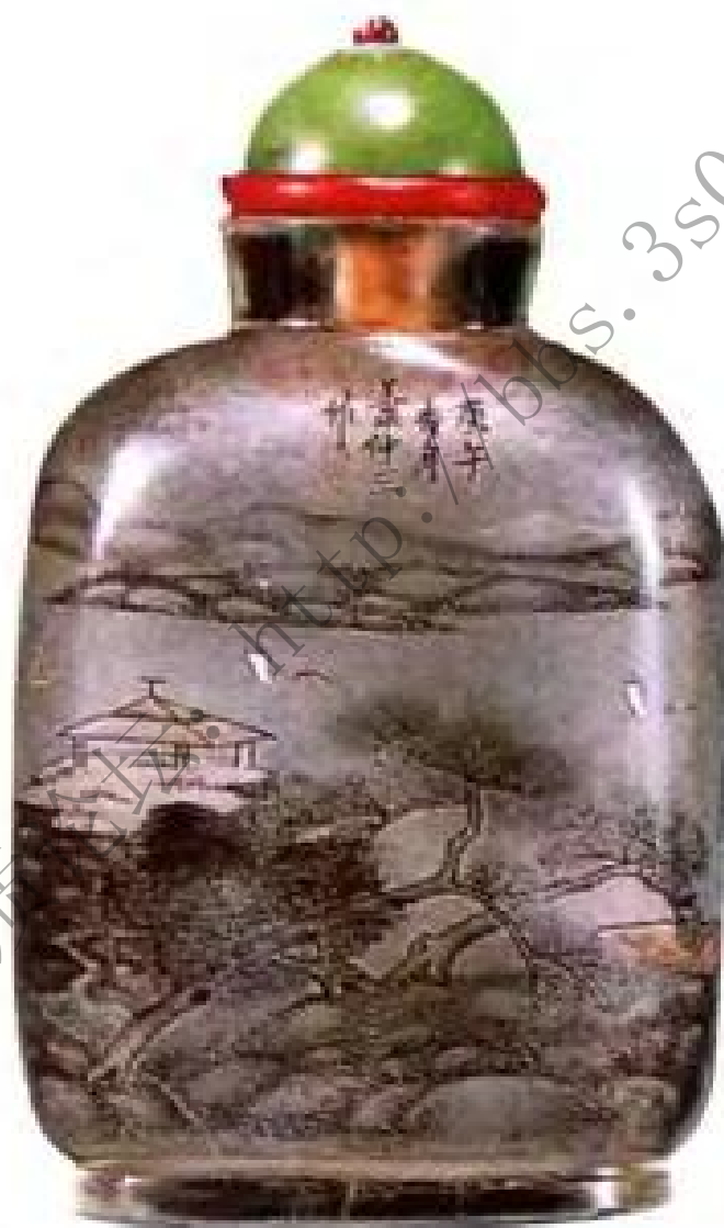
叶仲三内画山水鼻烟壶 市场参考价：人民币25,000元