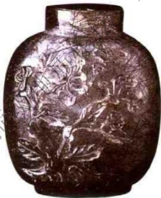
图59 现代仿古 发晶鼻烟壶 1985年 以后广东潮州玉器作 坊大量生产仿古发晶 鼻烟壶，特点是壶身 形状不规整，颜色发 黑灰色，不明快。