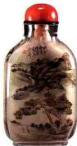
图85 丁二仲内画仿南田老人山水鼻烟壶 丁二仲对传统山水画研究极深，也常将古人山水临于其作品之中。