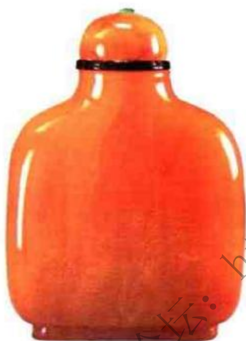
图101 清乾隆蜜蜡鼻烟壶 蜜蜡质地软，易破损，传世蜜蜡鼻烟壶十有八九不完整，此壶色泽柔和，造型大方，毫无破损，是一件十分完美的精品。

法之徒以新合成树脂冒充琥珀，或以新琥珀加工成旧器形，以新充老，图谋暴利（图101）、（图102）。