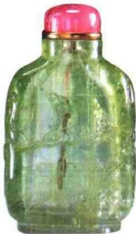
图66 清中期绿碧 玺鼻烟壶 在清代海蓝 宝石、绿橄榄石均被归 为碧玺类，称蓝碧玺、 绿碧玺，这类鼻烟壶一 般体积小，随形雕花者 较多，折方形少，价值 比一般高许多。