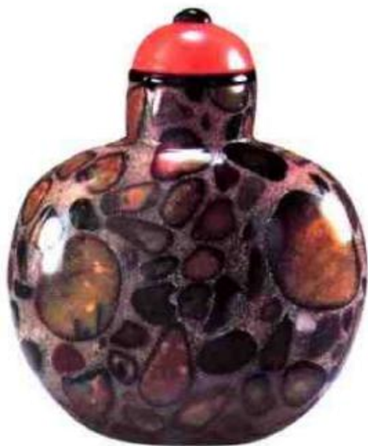
图72 清中期彩石鼻烟壶。中国地大物博，各地石质不同，彩石鼻烟壶因此成为一大类，深受西藏、蒙古少数民族人民喜爱。