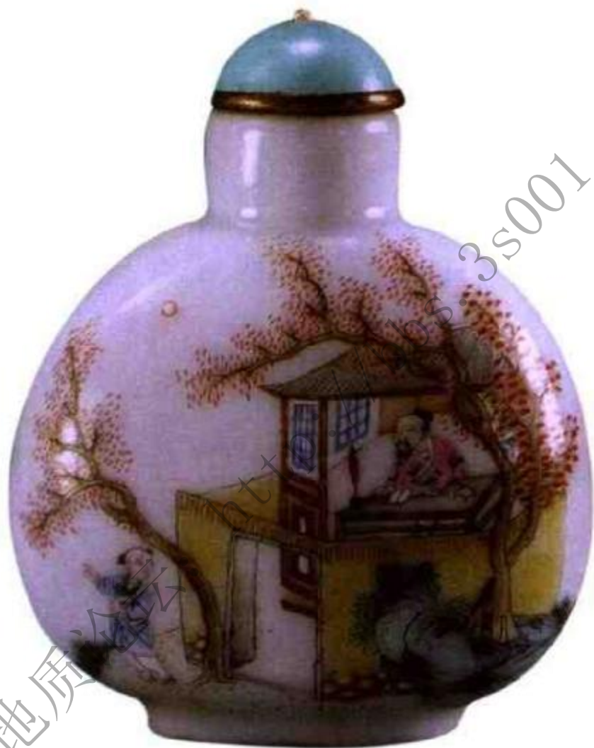
图32 清道光月夜诗书图粉彩鼻烟壶 这种瓷烟壶的形状是道光及道光以后较常见的品种，此壶色彩淡雅，底款“道光年制”应是道光本年民窑。