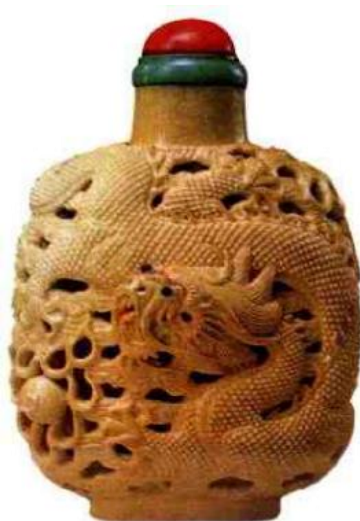
清中期黄釉龙纹雕瓷