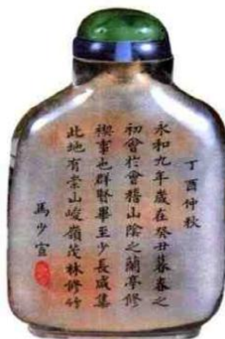
图76 马少宣内画仿名人书画鼻烟壶 《兰亭序》是古代王羲之书法精品为历代文人所推崇，马少宣许多作品中出现《兰亭序》是其传统文人思想的反映。