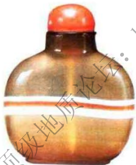
图53 清中期玛瑙腰横玉带纹鼻烟壶 冰糖玛瑙壶腰中两条天然白色玛瑙纹，象玉带一样横于腰中，故称“腰横玉带”。