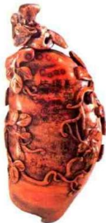
图94 清后期 竹根雕 鼻烟壶 竹雕盛 行于南 方，以 江浙 居多 竹根雕 鼻烟壶 存世不 多。