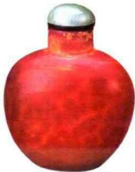
图16 清中期仿雄黄料鼻烟壶雄黄也叫鸡冠石，是一种矿物，成分是硫化砷，橘黄色，有光泽，用来制农药，染料等，中医可入药。民间常将雄黄掺于烧酒中，制成雄黄酒，在端午节时饮用。此壶光泽柔美，体态端庄，只是颜色与雄黄色相比略显红，现代仿品一般光泽较强，俗称“火大”。