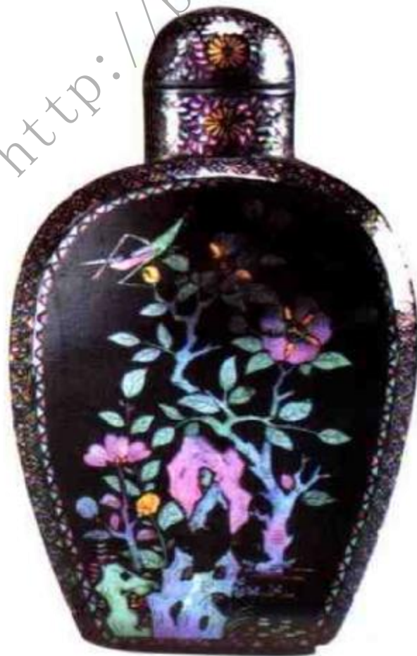
图104 清中期 黑漆嵌五彩螺钿鼻 烟壶 此壶工艺精 细，用料考究，应 是宫廷制品。

和“硬螺”两种，“硬螺”年代早于“软螺”。“软螺”在晚明时才开始大量流行。鼻烟壶器形小，胎薄，几乎全为嵌“软螺”。京城皇家造办处所制雕漆鼻烟壶，嵌五彩螺钿鼻烟壶均异常精美（图104）、（图105）、（图106）。