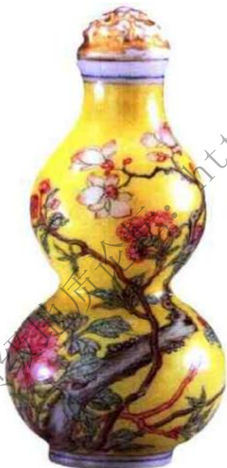
图10 料胎画珐琅黄地绘花卉葫芦鼻烟壶 画工精美，色彩娇艳，壶形文雅隽秀，足底蓝料书“古月轩”三字款。

上述三种说法均没有根据，不论古月轩的名称由何而来，古月轩款鼻烟壶均是画工极精，且注重诗文，一见便知是大家名手所制，绝非凡夫俗子能为之（图10）。