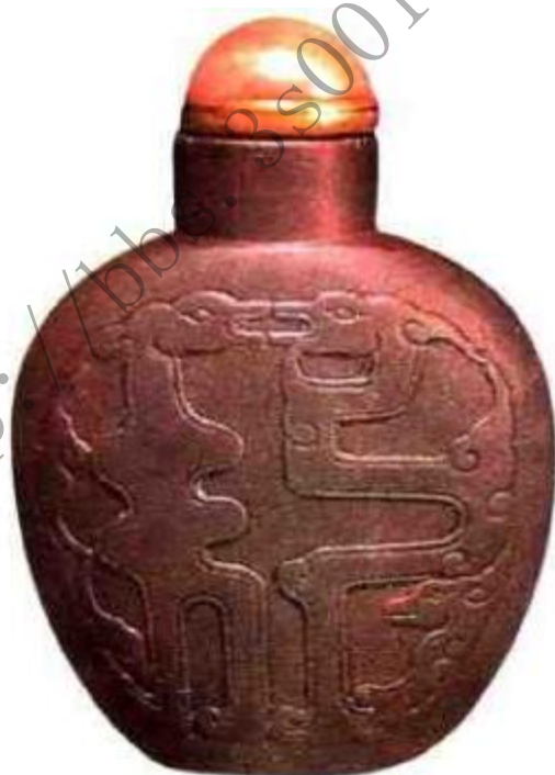
图68 清中期端石雕蟹甲传卢图鼻烟壶 赏菊花，品美酒，食肥蟹，是中国古代文人的三大爱好，鼻烟壶上雕蟹，比喻壶中鼻烟为美味，展现出中国古文化之含蓄。