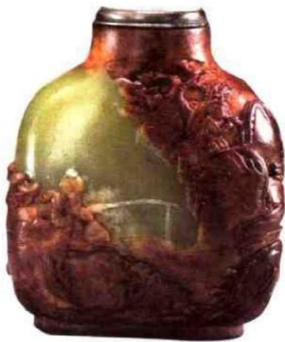
图44 清中期青黄玉留皮巧雕高士垂钓图鼻烟壶 壶中留皮处巧雕山景、高士，露玉底处表现为绿水，构思巧妙，是清中期留皮巧雕佳作。