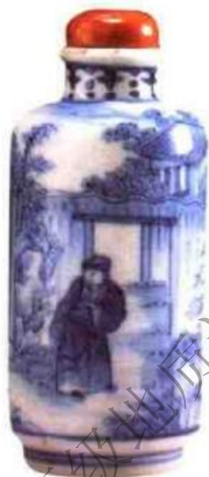
图23 清道光慎德堂款青花人物鼻烟壶 画意自然，口沿处出现暴釉现象（胎釉结合不紧密出现釉剥落，俗称暴釉）是道光以后瓷器常见现象。