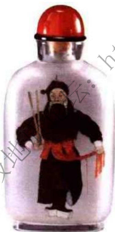
图73 马少宣内画京剧人物鼻烟壶 京剧艺术在马少宣生活的年代达到高峰，马少宣作品中许多题材来源于京剧。

笔法苍劲，得欧阳询之风骨，无论临碑还是书文均卓然不群。其内画肖像技法也是名冠京城，所绘肖像无不生动传神，宛如照片。其他内画作品题材包罗万象、草虫、花卉、人物、历史典故、民间传说，无一不精，一笔·画庄重清雅秀丽均是大师风范（图73）、（图74）、（图75）、（图76）、（图77）、（图78）。