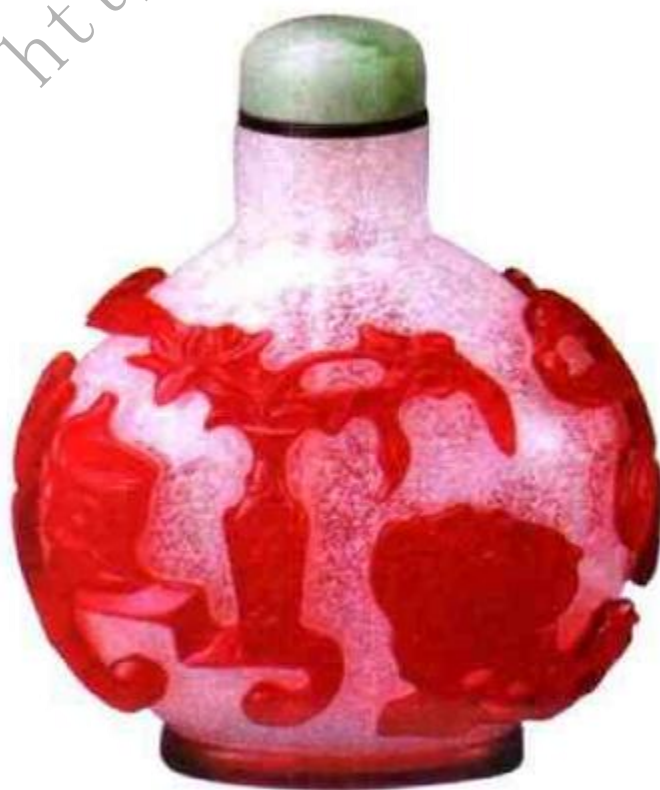
图20 菲雪地套 红料博古纹鼻烟壶 菲雪地是清代套料最 常用的底胎。菲雪地 套红也是最常见的品 种，此壶雕工简洁， 利落构图文雅，是常 见品种中的精品。