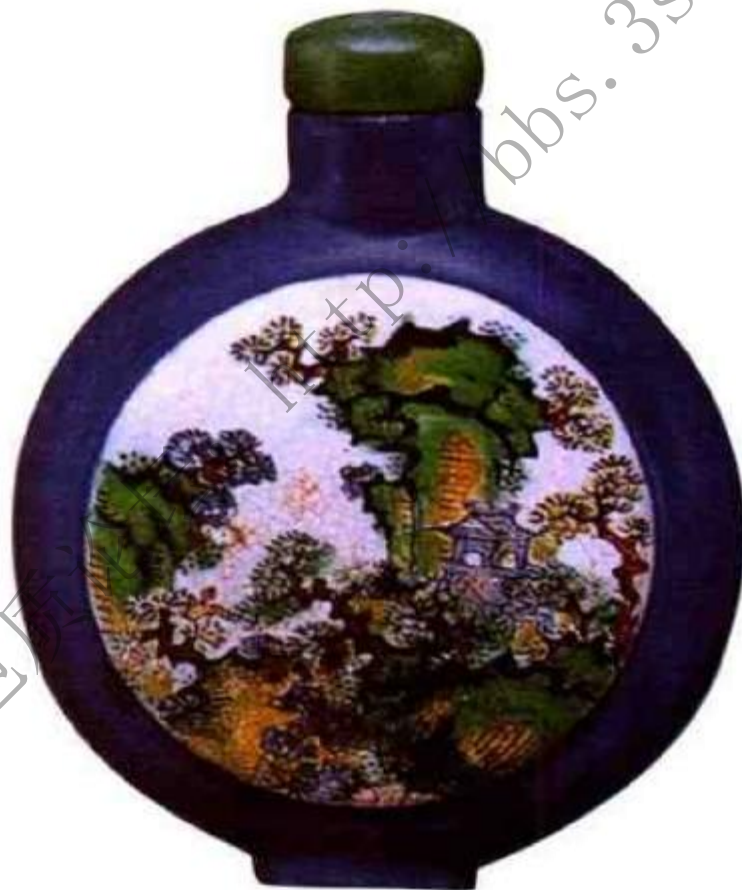
图36 紫砂蓝釉开光加彩山水鼻烟壶 清中期受社会崇尚紫砂热潮的影响，紫砂鼻烟壶也不断出现，有施釉和不施釉两种，此壶先制成紫砂胎，再在紫砂胎上加彩绘，入炉低温烘烧而成。

造的紫砂鼻烟壶，造型秀美，画工、刻工文雅古朴，不乏精品，款识大多为年款或堂记，少量人名款，图记款（图36）、（图37）、（图38）。