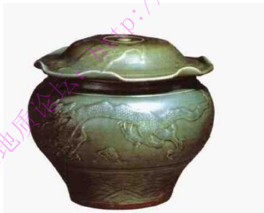
元龙泉瓷贴花龙凤纹盖罐

的龙泉窑出现了一些变化，如胎体比以前厚重，釉色青中泛黄，施一次釉，显得薄而涩，俗称“黄龙泉”。器型显得高大、浑厚，纹饰出现印花、贴花、镂空、露胎贴花等装饰。碗、盘底足较以前高，外底采用砂圈叠烧，使外底出现一圈呈紫色的涩圈。有的外底无釉，中心呈鸡心点凸起。