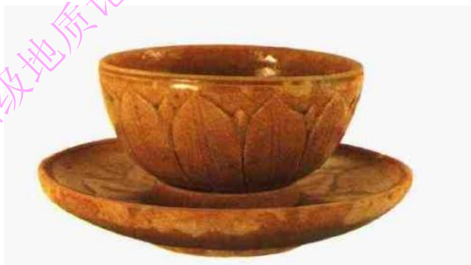
南朝越窑青瓷莲纹托碗

试想，龙泉窑如果到南宋以后，仍没有开拓性的发展，无论从烧造工艺，器物造型，釉色，装饰都停留在唐、五代以前的水平上，只有对越窑的继承，没有创新，那么后人将其称之为龙泉窑也就多余了。