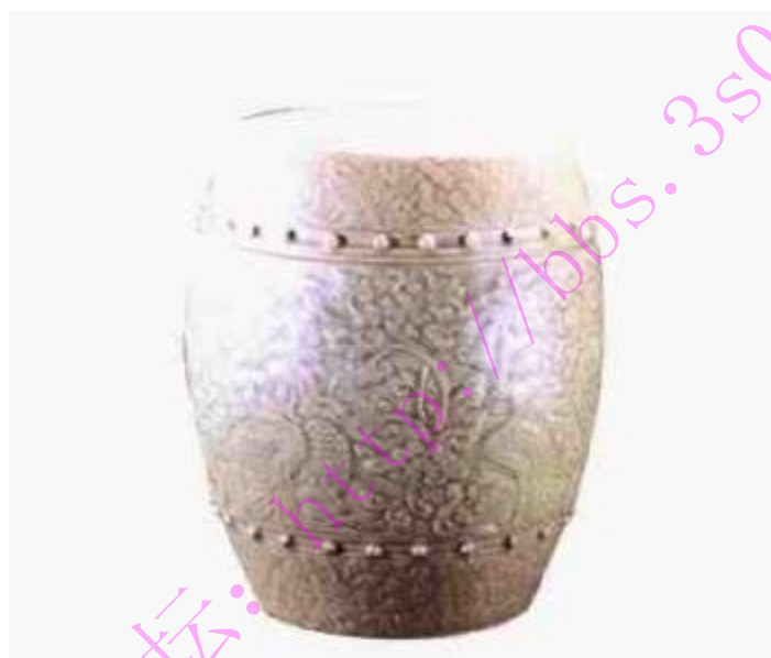
明龙泉瓷模印鼓瓮