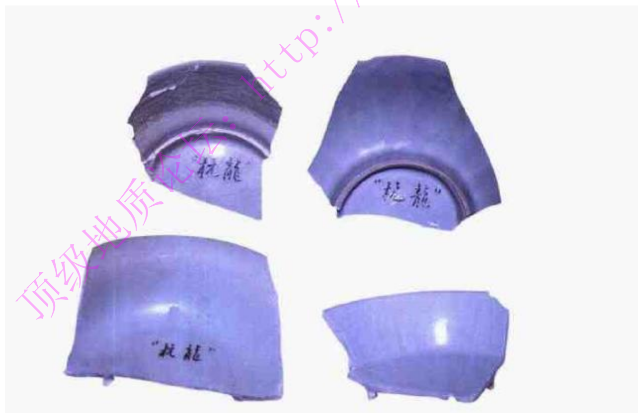
收藏圈内所称的“杭龙泉”，不知窑址在杭州何处，待考

6. 在工艺上，北宋时期多用支钉支烧，器物多有支钉痕。到了北宋晚期开始采用圈足内放垫饼垫烧。