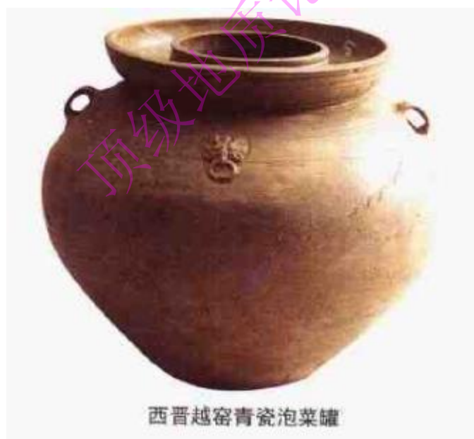
西晋越窑青瓷泡菜罐

如碗，西晋时上腹近直，下腹向内斜收略向外弧，有的上腹饰弦纹、斜方格纹或连珠纹；东晋时碗的下腹向内斜收，有的外口沿划一道弦纹。盘口壶，西晋时盘口较大，颈短，腹部矮胖，平底内凹，肩部装双系或双复系，饰弦纹、斜方格纹，也有贴铺兽的；东晋时盘口缩小，颈与腹部加高，饰弦纹或褐色贴彩。水盂是盛水的文具，水的用量不大，所以器形小。为了防止盂内的水外溢，故做成敛口扁圆腹。其中西晋的腹较扁，平底，肩部饰锥刺纹或斜方格纹；东晋的扁圆腹较高，底由平底演变成饼形底。