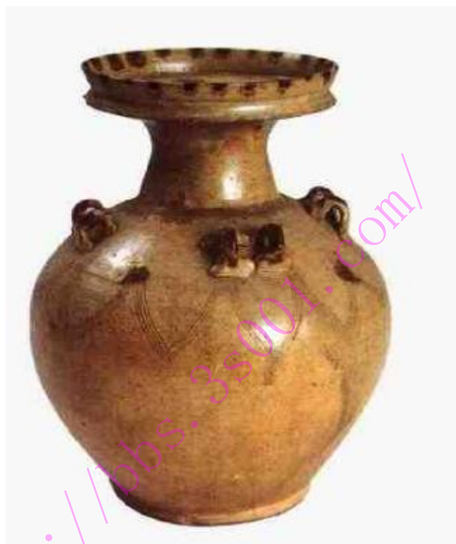
东晋越窑青瓷褐色点彩盘口壶

越窑是对龙泉窑影响最大的青瓷窑场之一。它创烧于东汉，衰落于北宋。三国两晋时期，正是越窑青瓷的繁荣时期，除了上虞曹娥江两岸及慈