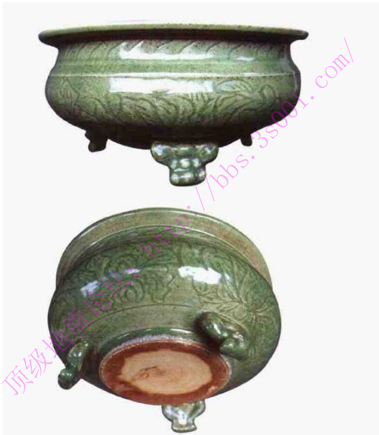
仿元代兽蹄三足炉