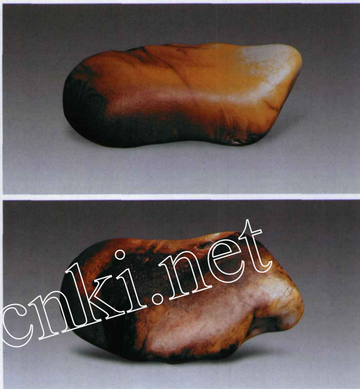
和田羊脂白玉仔料 38 × 21.5 厘米 估价: RMB 1,800,000~1,800,000 拍卖公司: 上海正浩 拍卖日期: 2006-11-19

掂一掂有沉重之感。特别是羊脂白玉,用手触摸时就像触摸婴儿的皮肤一样,温润细滑,并且有油脂般的感觉。当然,各种玉的冰凉、润滑程度是不一样的,即使是同一种玉,其感觉也不一样。这就要求我们经常抚摸、把玩各种不同类型的玉石,寻找其特有的感觉。石头或质地较差的玉,以及塑料及玻璃一类的仿制品,在触摸或把玩时没有玉的温润感,粗涩干燥,手感既轻飘,又无冰凉的感觉。