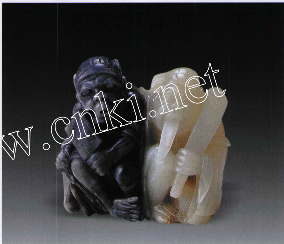
清和田玉巧雕黑白无常摆件 尺寸: 高6.5厘米 成交价: RMB 13,200 拍卖公司: 北京传是 拍卖日期: 2003-05-19