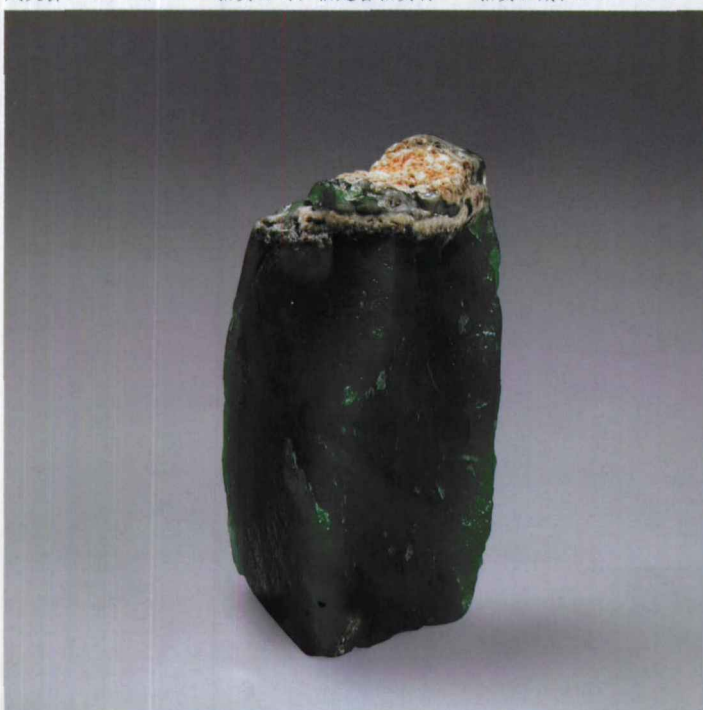
翡翠 成交价: RMB 7,623,000 拍卖公司: 澳门中信 拍卖日期: 2007-02-11

所以被称为我国四大名玉之一,应该说透明度起了关键性作用。但是,并非透明度高的玉就一定是好玉。