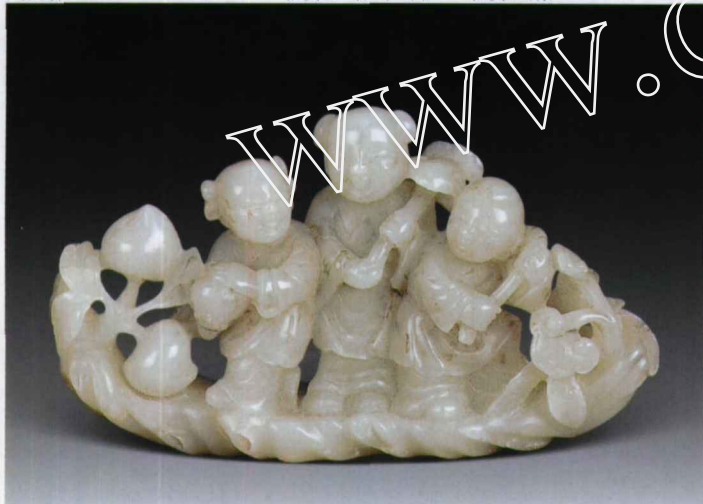
清 和田玉福祿寿三合童子乐摆件 长9.5厘米 成交价: RMB 15,400 拍卖公司: 福建省拍卖行 拍卖日期: 2006-12-29