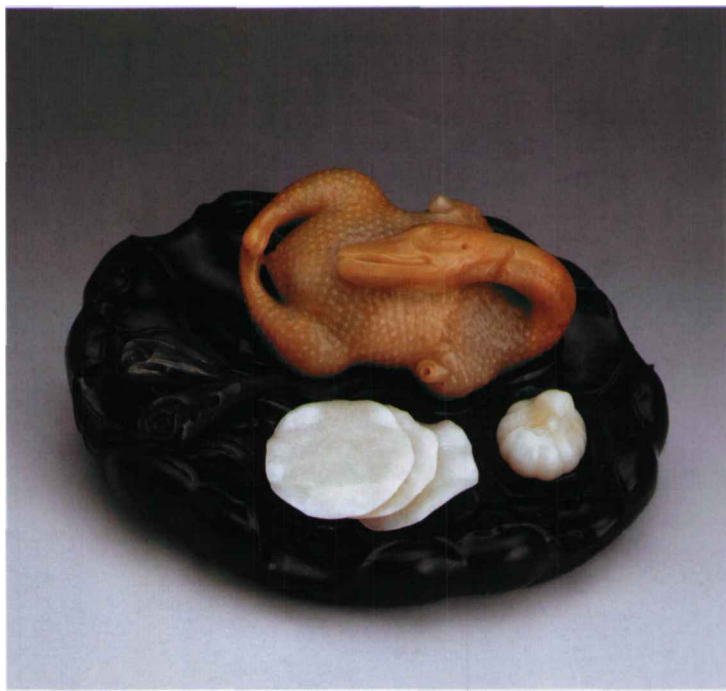
和田玉雕烤鸭 (一套四件) 成交价: RMB 38,500 拍卖公司: 中鸿信 拍卖日期: 2006-06-27