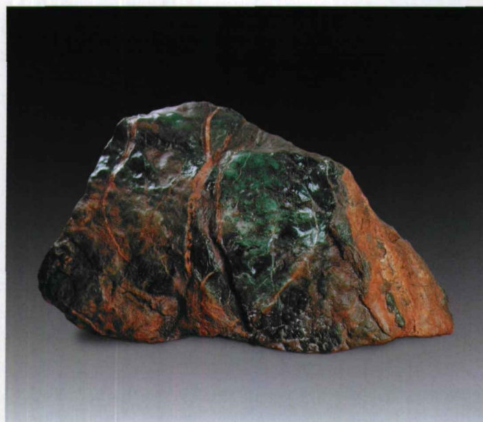
翡翠原石 110 × 55 × 60 厘米 成交价: RMB 88,000,000 拍卖公司: 中鸿信 拍卖日期: 2005-05-18