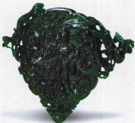
现代翡翠“嫦娥奔月”佩饰 成交价: RMB 5,500,000 拍卖公司: 北京翰海 拍卖日期: 2004-11-22

硬度是鉴别玉石的主要标志之一, 对玉器的琢磨加工很重要。硬度大的玉石制作的玉器抛光性好, 同时保存时不易受损, 越把玩光洁度越好。比如和田玉的摩氏硬度为6.5~6.9之间, 高于玻璃的摩氏硬度6。在选购和田玉材或玉饰品时, 用其在玻璃上刻划会留下明显的划痕, 而它却丝毫不会被损伤。硬度高的玉材, 雕工