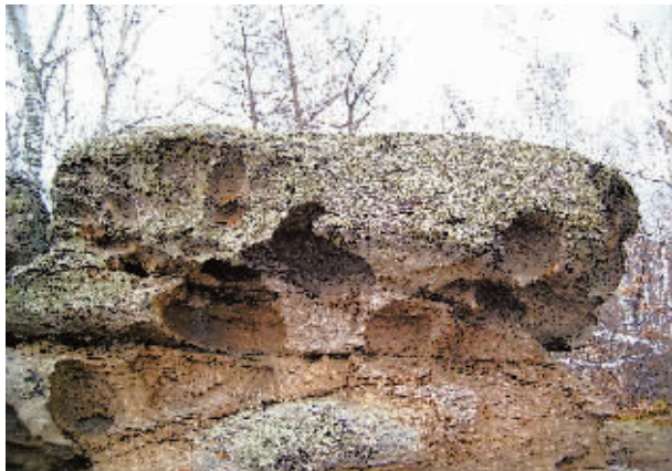
冰石湖侵蚀的花岗岩体