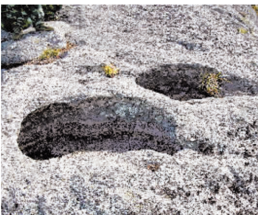
当地昆仑山发现数千冰臼

冰川湖。 该旗达尔滨湖等大小湖泊均属冰川湖,为古冰川对下覆基岩进行强烈的掘蚀产生的; 冰蚀柱。 冰蚀柱位于该旗诺敏河中。被当地称为“烟囤石”,高约15米,宽5米,长10米,是我国最奇特的冰蚀柱;