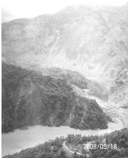
图3 北川县上游通口河干流的唐家山堰塞湖

成串珠状分布,如北川通口河湍江上连续分布7个堰塞湖,其中唐家山堰塞湖危险最大,堰塞湖溃决后会引发下游一系列堰塞坝逐级溃决,具有级联效应,使溃决洪水逐级加大,将严重危害下游沿岸城镇、村庄、其它基础设施和100余万人生命财产安全。