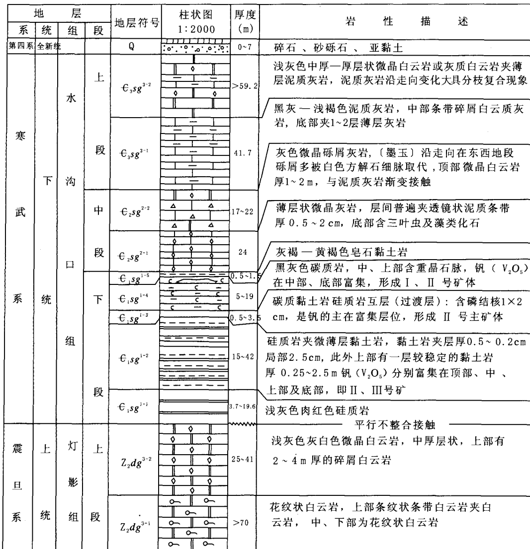
图 2 综合地层柱状剖面图