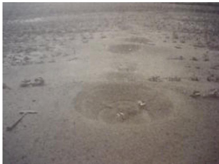
图3： 液化现象引起的喷沙痕迹 （北海道南西冲地震：濑棚郡今金町拍摄）

(a) 塌方 地裂 ——地震时发生频率最高，灾害的大小由其下方的地基状况决定。塌方和地裂有的是由于地震引起的地基直接运动，有的则是由于地基沙土液化所造成的。