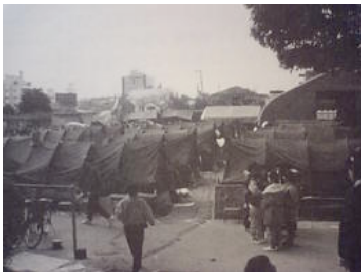
避难所的孩子（阪神・淡路）

住宅严重损坏，不能回到以前生活的人在搬进临时住宅之前一直住在避难所里。有的人看着别人一个个回到自己的家里，受到不安、疲倦、心里的创伤和矛盾所困扰，变得无精打采。灾害发生时，避难所里的人是受灾者，而在灾后重建开始后，避难所里的人就成了社会弱者。同时，志愿活动也由“非常时期的紧急支援”转变为“日常时期的生活重建支援”，而救灾志愿者则开始撤离灾区。搬入临时住宅的工作结束后，避难所将被关闭，同时，开始转入每一个人长期的生活重建工作。