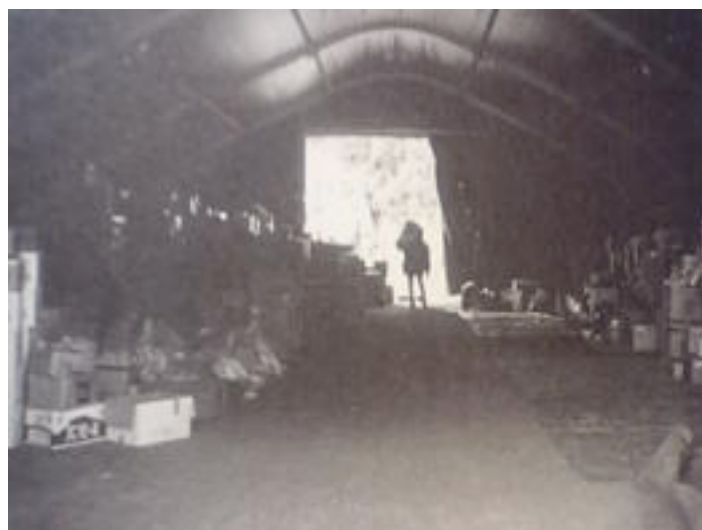
图片 许多救援物资正运往灾区

抗灾指挥部应及时掌握上述设施的情况，并立即着手进行建筑物安全性能调查、协调食品毛毯等物资的供应、确保发电机、临时厕所等的设置。