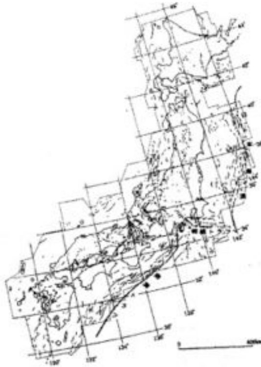
图2： 日本列岛周边的主要的活动断层（大矢等，2001）

近几年，地震和活断层的关系被特别关注。比如说1995年兵库县南部的阪神—淡路大地震就被认为是地下的活断层发生移动所引起的。活断层是指过去170万年间移动过的断层的旧伤。