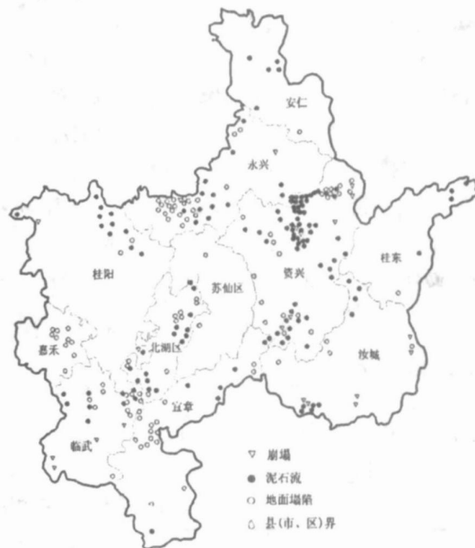
图 2 郴州市崩塌、泥石流、地面塌陷分布图