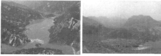
图 12 唐家山堰塞湖