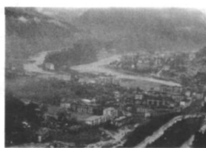
图10 泥石流(北川县城)

除了山体滑坡外,泥石流也是此次地震中破坏力极强的灾害。泥石流是山区沟谷中,由暴雨、冰雪融水等水源激发的,含有大量的泥砂、石块的特殊洪流。其特征往往突然暴发,浑浊的流体沿着陡峻的山沟前推后拥,奔腾咆哮而下。在很短时间将大量泥砂、石块冲出沟外,在宽阔的堆积区漫流堆积(图10、11)。