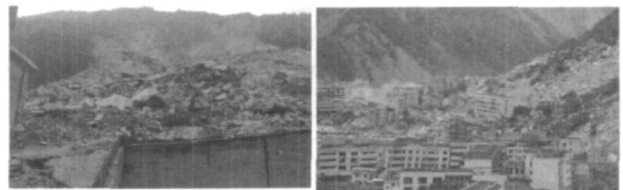
图 14 山体滑坡造成学校破坏(北川) 图 15 建筑物大量破坏(北川)

在汶川地震中,除了大部分建筑物直接遭受到地震力的破坏外,仍有一部分建筑物由于处于不利的地形或者位于易发生地质灾害的山脚而遭受比直接灾害更为严重的破坏(图 14),且范围广、破坏力大(图 15)。因此,防止建筑物遭遇地质灾害,应引起足够重视。为减轻地质灾害,在工程建设之前,应未雨绸缪,事先做好城市建设用地的适宜性评价。在规划选址中,应避开地质灾害易发地段。对已经存在的边坡和高挡墙,应有监控措施。