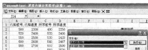
图 1 速度内插计算程序界面

的 VBA 语言编写宏程序来计算,更简便,例如某区横向变速时,根据已知的几点速度和其对应的桩号,求取其他桩号相应的速度,仍输入公式来计算烦琐易出错,用 VBA 语言编写速度内插计算程序实现自动判断计算,程序界面见图 1。勾绘等值线需要三维数据( x, y, z ),桩号的平面 x, y 坐标,逐个在测量成果中查找工作量,而用测量公式计算,则受专业知识制约。因此编写了坐标内插计算程序实现计算自动化,程序界面见图 2。使用时点击执行便能得到结果,非常简单快捷。