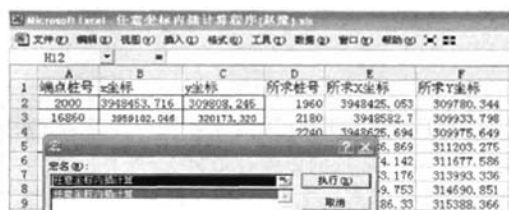
图 2 坐标内插计算程序界面

经过计算获取了绘制等值线的三维坐标( x, y, z )(表 1),一对 x, y 坐标可以对应多个 z 值, z 值可以代表 t_0 时间、煤层底板高程 h 、地层厚度、元素含量等。这个 Excel 数据可以直接被 Surfer 绘图软件打开调用,不用转换格式。