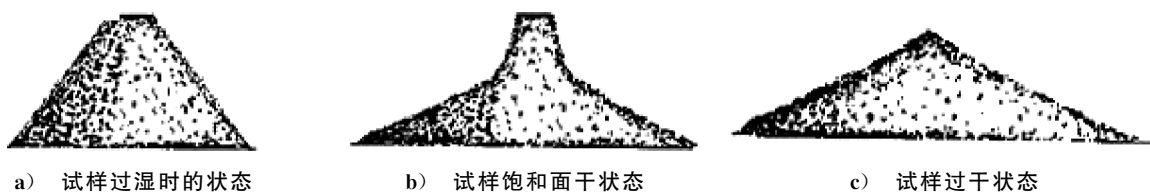
图3 机制砂饱和面干试样的状态