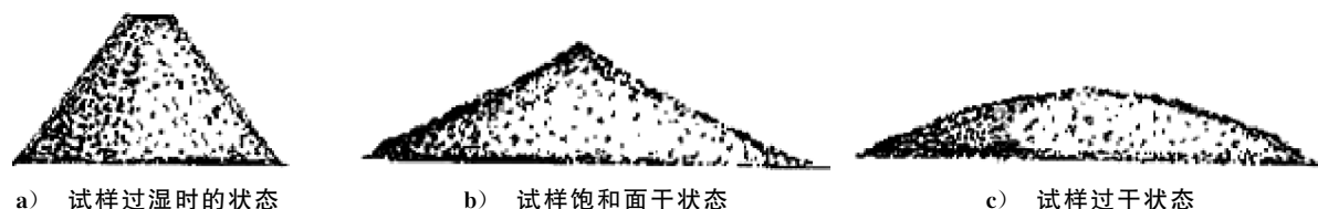
图4 天然砂饱和面干试样的状态

7.19.2.4 立即称取饱和面干试样 500 g,精确至 0.1 g,倒入已知质量的烧杯(或搪瓷盘)中,置于 (105 \pm 5)^{\circ}\text{C} 的干燥箱中烘干至恒量,在干燥器内冷却至室温后,称取干样的质量( m_0 ),精确至 0.1 g。