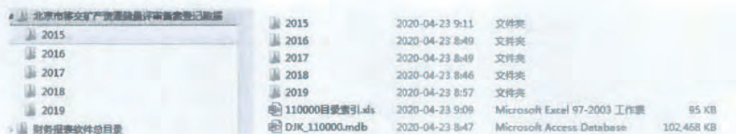
图 1 根目录