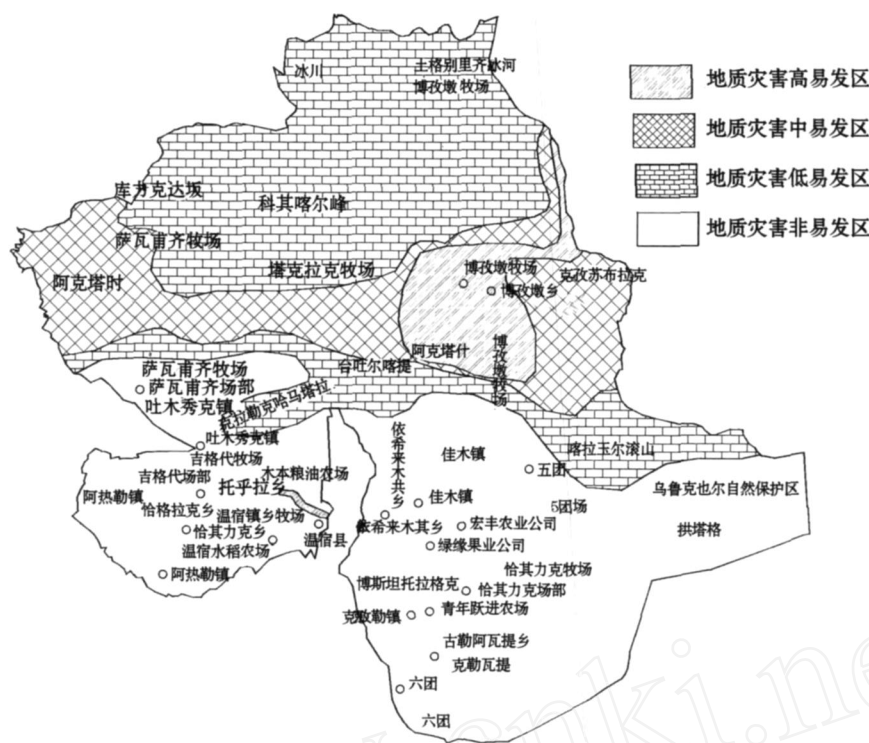
图 2 温宿县地质灾害易发区分区图 Fig 2 Subdivision of areas susceptible to geological disasters in Wensu County