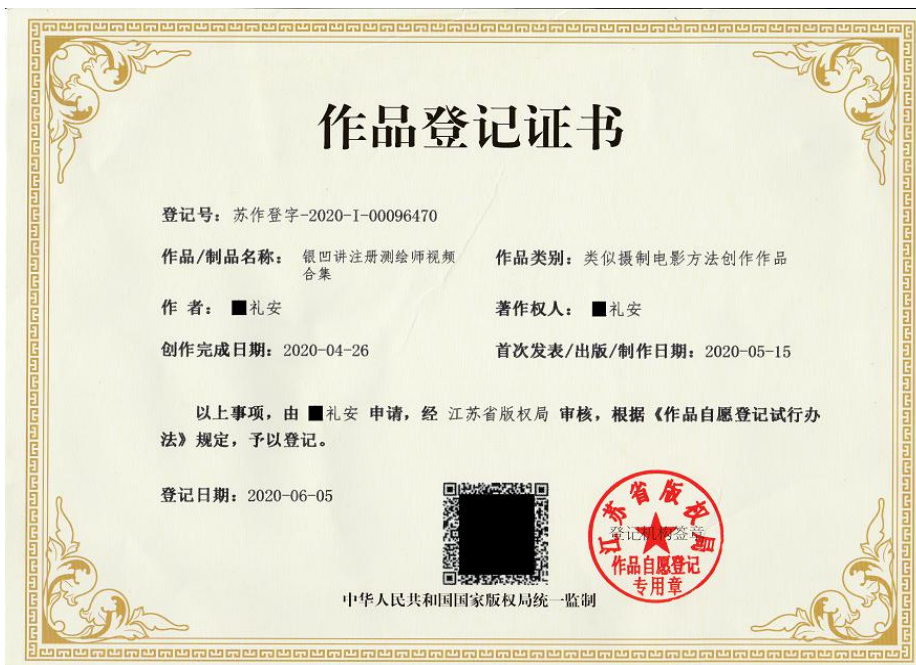
《银凹讲注册测绘师》视频课件取得江苏省版权局颁发的作品登记证书