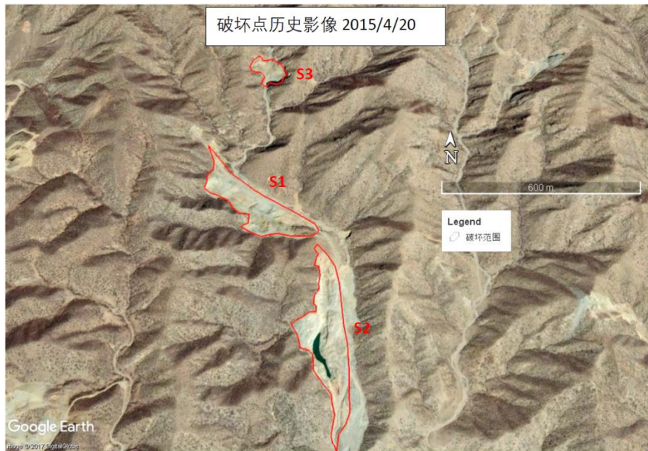
图 2 评估区历史遥感影像

根据《生态环境损害鉴定评估技术指南 总纲》（环办政法〔2016〕67号）与《生态环境损害鉴定评估技术指南 土壤与地下水》（环办法规〔2018〕46号）中规定的基线确定方法，结合本项目实际情况，采用样方调查法对破坏点附近未被破坏山体进行植被调查，以获取基线水平的植物群落构成、高度等群落特征信息，包括柄扁桃、黄刺玫、克列门茨针茅的高度、冠幅、株数等信息。通过跟基线水平的比对，确认评估区生态环境受到损害。