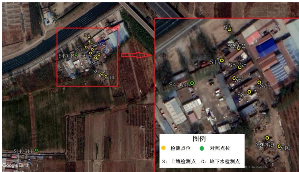
图 3 采样布点图