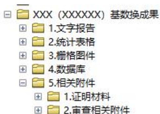
图 1 基数转换成果目录结构图

第十三条 基数转换成果目录结构如图 1 所示,目录名称中“XXX”指县级行政区名称,括号内的“XXXXXX”指县级行政区划代码。