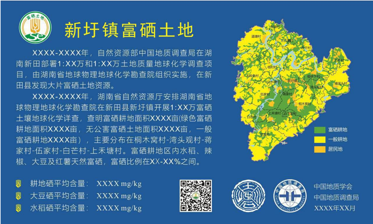
图 2 富硒土地标识牌示样