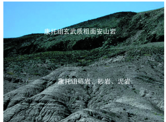
图2 走构由茶错康托组砾岩与火山岩

Fig.1 ETM images of the Kangtog Formation at Zougouyouchacuo