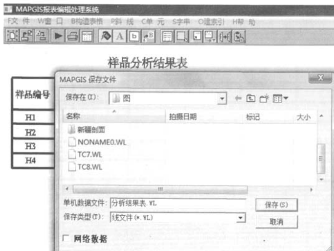
Fig.3 Save file