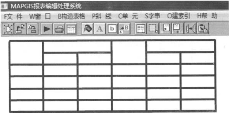
Fig.1 Make a form

放在表格上外框线或左外框线，按住鼠标左键进行移动，也可在“移动一列”或“移动一行”对表格的宽度和高度进行修改。菜单栏“构造表格”→“增加一行”或“增加一列”，也可用“删除一列”或“删除一行”来进行编辑表格的行数和列数。菜单栏中的“斜线”命令可编辑单元格内的斜线，随意调整斜线的角度。