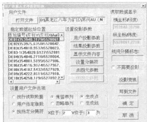
图 1 MapGIS 用户文件投影窗口

(1) 打开用户文件。MapGIS 系统主菜单→投影变换→MapGIS 投影变换系统→用户文件投影转换→打开文件。打开需转换的文本文件(图 1)。