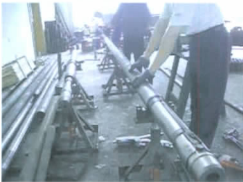
图 2 试制出的保压、非保压取心钻具与室内调试 Fig. 2 Trial-produced pressurized, non-pressurized coring boring tool and indoor debugging