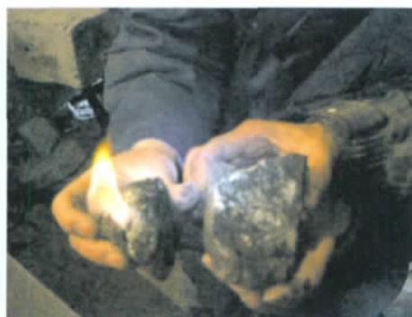
b. DK1 孔取出的水合物样品