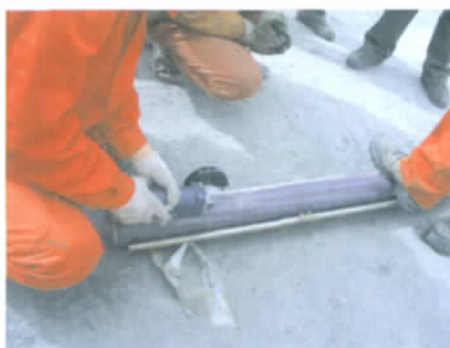
d. PVC 透明 3 层衬管取样