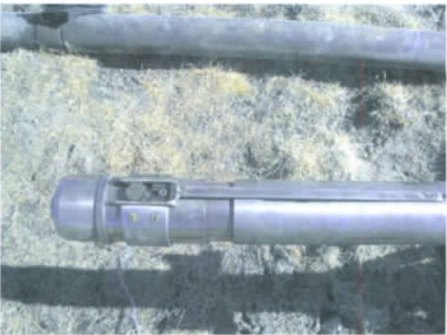
图 3 现场准备下井的保压取心钻具内管一部分 Fig. 3 On-site preparation of part of inner pipe assembly of pressurized coring boring tool for running back into the hole

不到 80%。因此,加拿大、美国在陆地冻土水合物钻探取样施工中仍采用绳索打捞不提钻快速取样技术。根据加拿大、美国等在冻土带天然气水合物钻探施工方面的经验,项目组除了试制出保温保压钻具外,还试制出了与保温保压钻具共用同一种规格钻杆的非保压不提钻快速取样钻具,试制的钻具见图2。