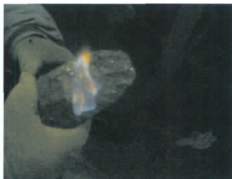
c. DK-2 孔取出的水合物样品