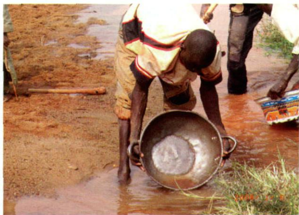
照片2 卡诺州砂金矿

(1) 马如-安卡费成矿带。该成矿带位于尼日利亚西部,呈北东走向,地层以前寒武-寒武系的糜棱岩、片岩系列为主。金属矿产为金、银、铜、铅、锌等,尤其以北部扎姆法拉州金、铜、铅、锌矿最多(照片1、2、3)。