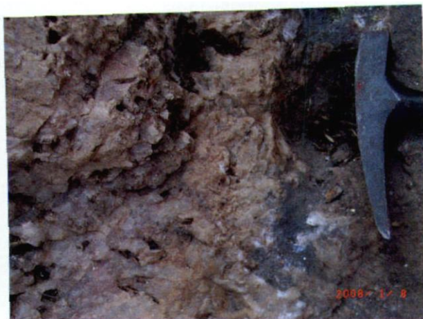
照片3 扎姆法拉州的果毕拉瓦铅、锌矿