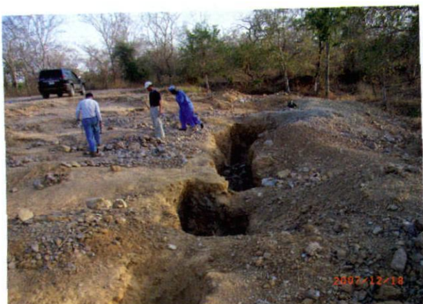
照片1 扎姆法拉州瑞拓铜铅锌矿