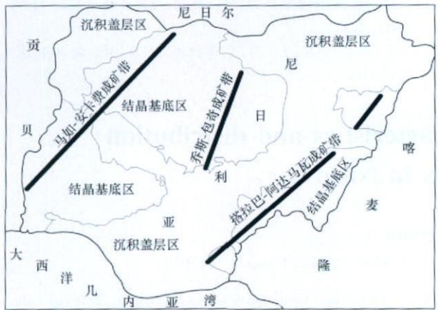
图 2 尼日利亚矿产分布规律略图

金属矿产金、银、铜、铅、锌、钨、锡、铌、钽、铁及各种宝石, 主要分布在结晶基底区, 具有区带分布特征。结晶基底区自西向东分 3 个成矿带 (图 2):