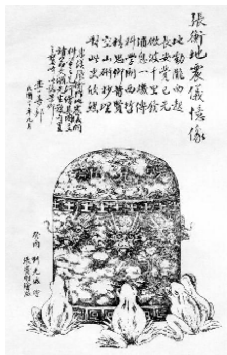
图3 1931年李善邦请翁文灏先生题诗的地动仪图画悬挂在鹭峰地震台