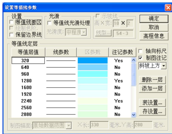
图 3 设置等值线参数视窗