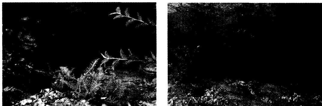
图 3 揭露采空区及充填物图

查的整体效果.从整体上,台阶下部大部分为低阻区,岩体电阻率随深度的增加而增加;图中出现的两片黑色区域,电阻率几乎为零,因此,可以推断此区域为先前地采留下的采空区,两空区埋深在距台阶面下 10~40 m,沿测线方向长度为 60~70 m.图中青色区域电阻率比黑色区域电阻率稍高,应视为由于上部地层塌陷使采空区被粘土、碎石填充,并且填充物较松散,含水量相对较高所致.再向下电阻率仍有小幅提高,推断为岩石破裂带,长时间即会形成较小的断层.其次,图中出现的较高电阻率区域,经现场调查发现为采矿出露的干燥岩石,并且以千枚岩为主.为证实上述推论,图 3 给出了后期施工中所揭露的空区及充填物的状况.