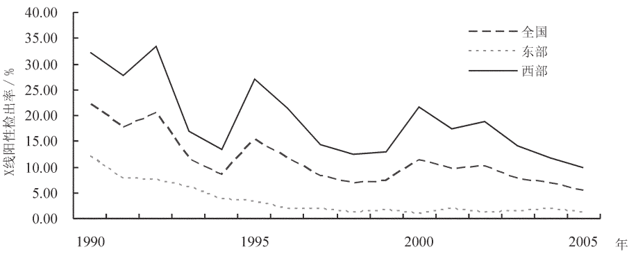
图 1 全国大骨节病病情监测时间动态图 Fig.1 Temporal dynamics of KBD prevalence rate in China