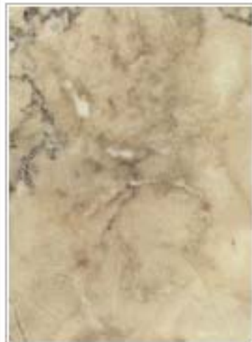
宜兴青奶油3258-B Grey Cream 江苏