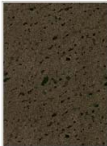
黑曜石(火山石) Volcano Black 黑龙江