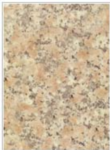
上虞菊花红3305 Chrysanthem... 浙江