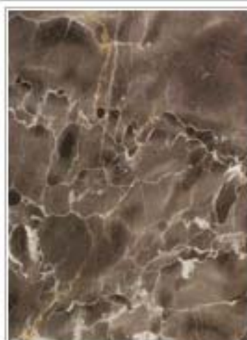
杭灰3301 Hang Grey 浙江