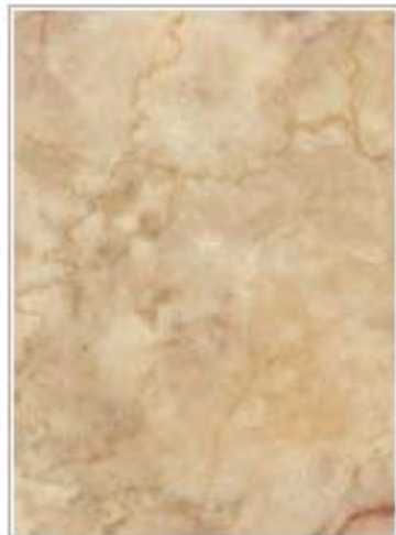
青红奶油 Grey Cream 江苏