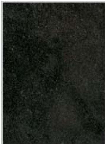
海南黑 Black Hainan 海南