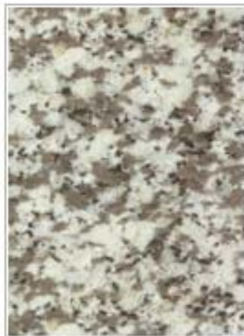
三门雪花3310 Sonw Flake 浙江