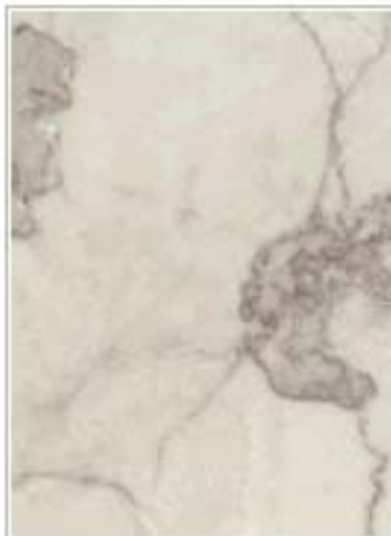
宜兴青奶油3258-A Grey Cream 江苏