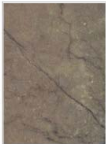
丹东绿2117 Green Dandong 辽宁