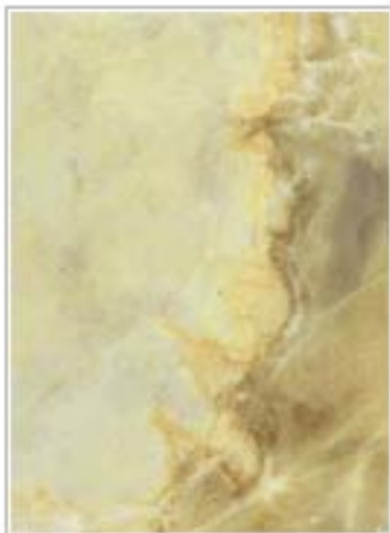
翠玉 Cui Jade 辽宁