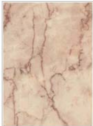
宜兴红奶油3259 Red Cream 江苏