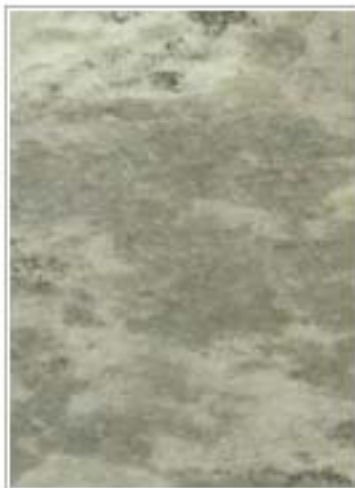
翡翠绿 Greenery 辽宁