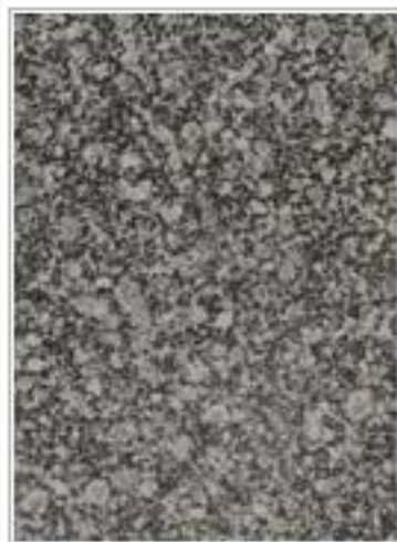
茶花绿 Tea Green 辽宁