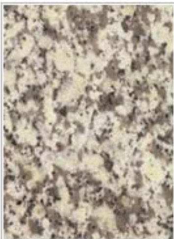
吉林白2201 White Jilin 吉林