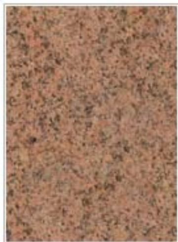
宁城红 Ningcheng Red 辽宁