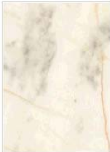
白奶油 White Cream 江苏