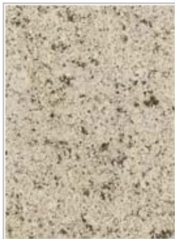
吐古尔白(啡点白) Tuguer White 安徽