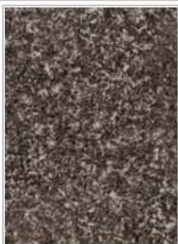
仕阳青3316 Black Shiyang 浙江