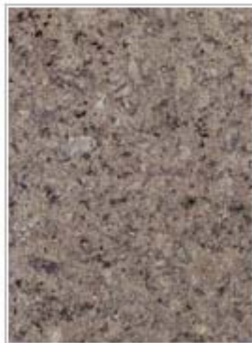
斯唉啡麻(珍珠兰) Pearl Blue 安徽