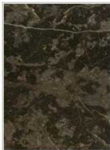
安徽大花绿 Green Flower 安徽