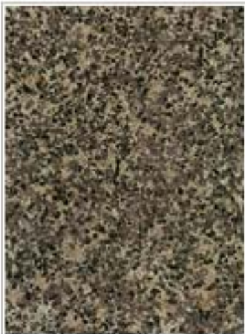
缅甸绿(昆仑绿) Burma Green 海南