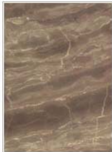
宜兴咖啡3252 Coffee Yixing 江苏