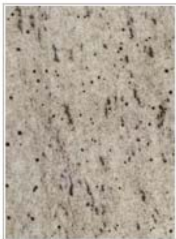
银河灰麻(银灰麻) Galaxy Grey Grain 安徽