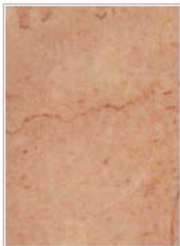
广红 Guang Red 安徽