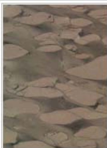
梦幻钻绿(金钻绿) Dream Green 浙江