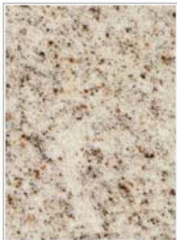
杰丹白麻(丹点白麻) Red Spot Grian 安徽