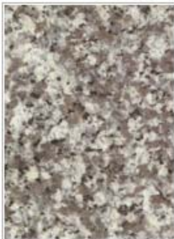
玉兰花-A Jade Blue Grain 吉林