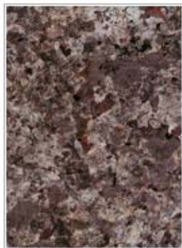
凤城杜鹃红2101-A Cuckoo Red 辽宁