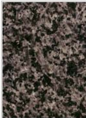
黑珍珠 Black Pearl 黑龙江