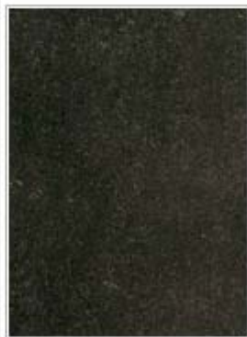
建平黑2102 Black Jianping 辽宁