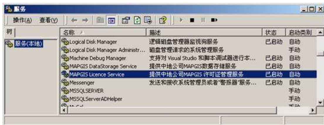
图 1 MAPGIS Licence Service 服务

如果您没有安装过 MAPGIS67 那么 MAPGIS70 学习版安装后会在目标机器上安装“MAPGIS Licence Service”服务，如下图所示：