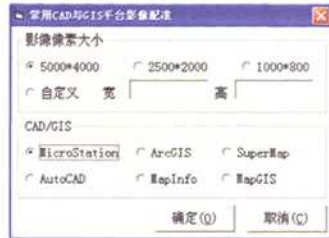
图 2 常用 CAD 和 GIS 平台正射影像图自动配准工具

笔者将上述介绍的方法和程序代码进行了系统集成, 用 VB6.0 编制了常用 CAD 和 GIS 平台中城市正射影像图的自动化配准工具: 用户不仅可以选择城市正射影像图中常用像素的大小, 而且可以根据影像的像素大小进行自定义大小, 在选择了某一平台后, 系统提示用户选择影像文件所在的目录, 单击“确定”, 系统自动完成该目录及子目录下所有影像图的自动化配准, 如图 2 所示。